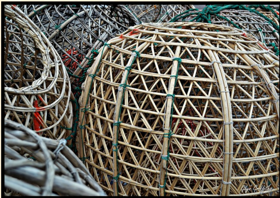
Nasa de pesca. Puerto de Mar del Plata.

Principalmente marinos; raramente son estuariales o continentales. Se distribuyen en aguas tropicales y templadas a ambos lados del Atlántico, los océanos Índico y Pacífico y el Mar Mediterráneo. En la Argentina y en Uruguay se encuentran las especies Diplodus argenteus y Pagrus pagrus . Esta última especie, es un pez de importancia económica cuya modalidad de pesca es la captura con nasa.