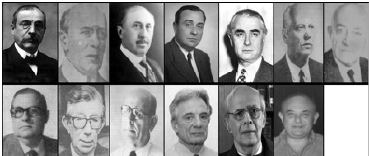
Figura 2. Profesores titulares de Neurología de la Facultad de Medicina de la Universidad de Buenos Aires (1887-1987).