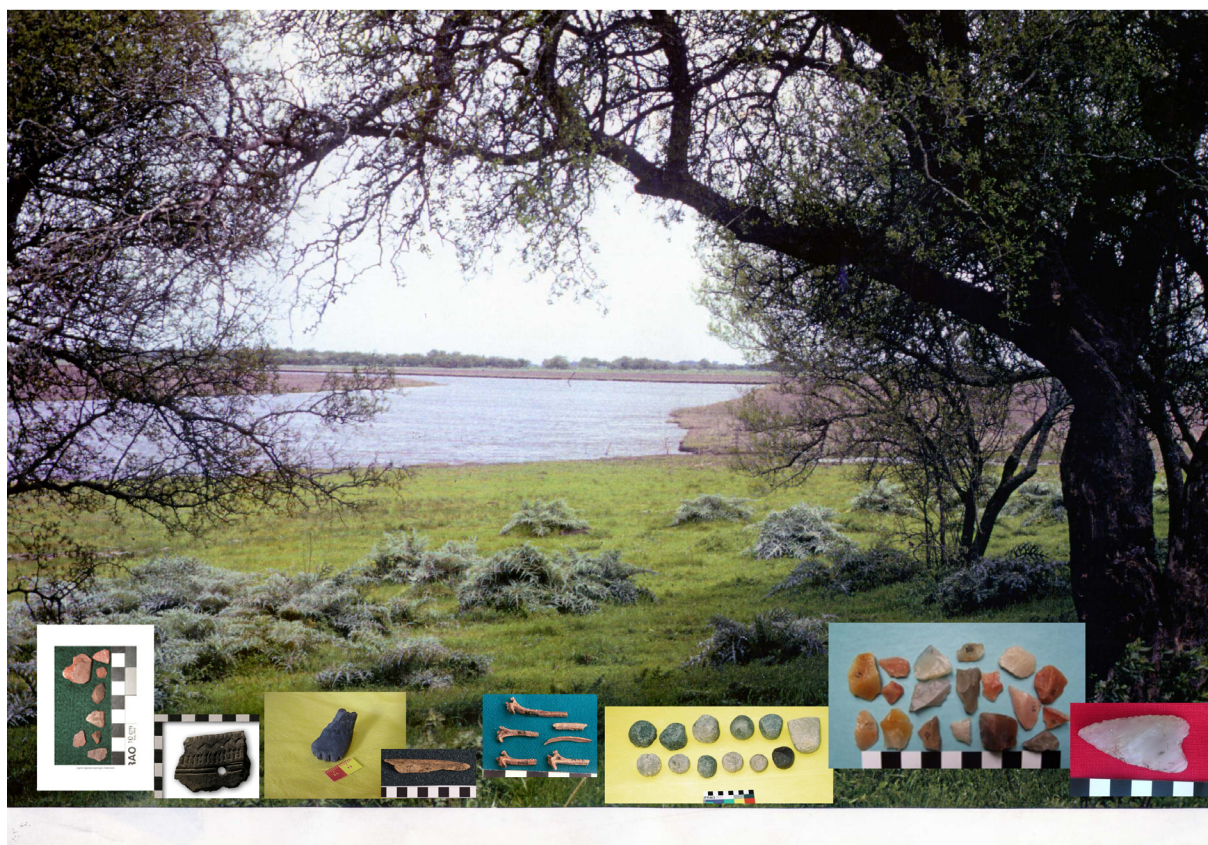
Figura 2. Paisaje característico de la microrregión y materiales arqueológicos recuperados en excavaciones.

asunto de interés público, estatal e institucional (Salerno 2014). Además, en el transcurso de esta investigación registramos una amplia gama de prácticas relacionadas con los materiales arqueológicos que exceden aquellas relativas a la producción de conocimiento y que en algunos casos preexisten a las mismas. En el marco de estas prácticas se construyen una serie de sentidos que en ocasiones entran en conflicto con las perspectivas del campo disciplinar. Puede mencionarse el uso de materiales de piedra pulida -principalmente bolas de boleadora- como decoración en espacios privados (casas de ámbitos rurales y urbanos), en espacios de trabajo (estudios; espacios para recibir al público; galpones de herramientas) y en puestos de ferias tradicionalistas. También registramos la conservación de materiales como recuerdo de travesías y expediciones en el río Salado y en una de las lagunas asociadas. Inclusive en algunas áreas rurales registramos el uso de lascas como amuletos de buena suerte. En contextos escolares, la presencia de lo arqueológico es recurrente en exposiciones de ferias de ciencias que abordan temas