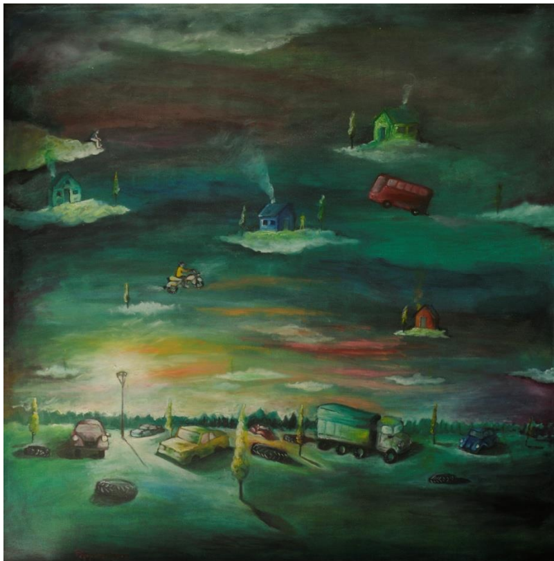
Entre el ayer y el mañana, óleo. Pablo Peppino

En este texto, buscamos argumentar, dotar de sentidos, como pedagogos desde nuestro lugar de irreverencia. Movilizar la relación de la pedagogía como normalidad, esperando descomponer sus saberes. Como un modo de expandir –pedagógica y vitalmente– una indagación sobre los contextos actuales de consolidación de políticas públicas neoliberales y de visualización de guerra contra quienes aparentan estar vulnerables y despojados de derechos humanos. Si bien las masacres contra los desprotegidos no son novedosas desde la articulación de la modernidad/colonialidad en América Latina, hoy son inmediatas –en términos de su cotidianeidad, cercanía y visibilidad pública– y amenazan profundamente la vida humana tanto desde dentro como desde fuera de la educación. Pretendimos, aquí, resaltar el valor de la pedagogía para con-vivir, a partir de preguntar, más que afirmar, sobre el lugar donde ubicamos sus saberes.