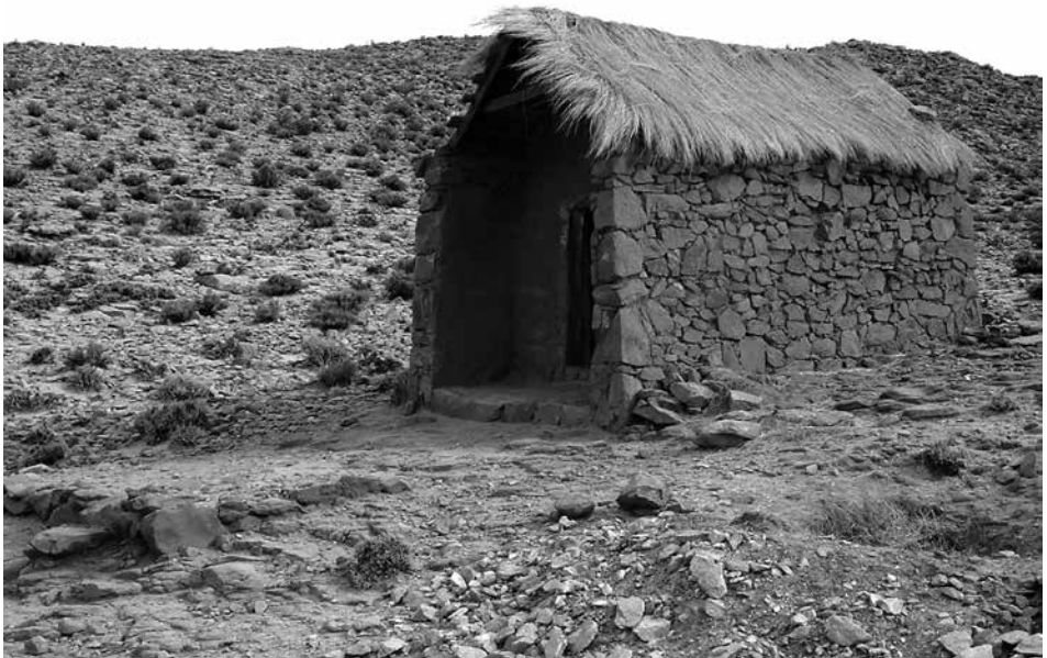
Figura 10: Oratorio enteramente construido en piedra con techado de guaya en Susques.