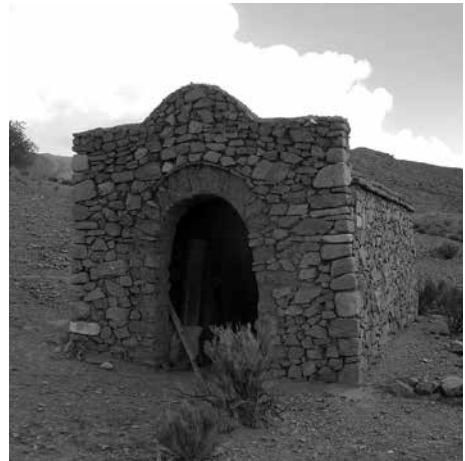
Figura 7: Oratorio con la antecapilla cerrada en Susques.