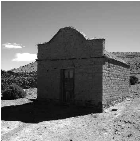
Figura 6: Muro prolongado verticalmente con el tratamiento a modo de espadaña, en los alrededores de Susques.

Anales del IAA #48 (1) - enero / junio de 2018 - (65-81) - ISSN 2362-2024