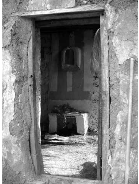
Figura 9: Detalle de la hornacina y del altar en un oratorio de Rinconada.