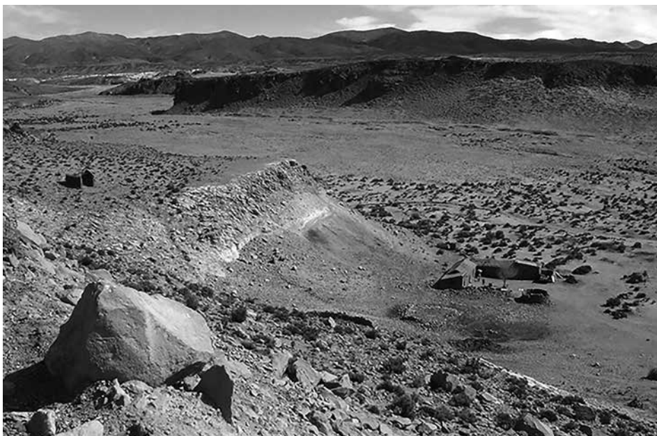
Figura 4: Ubicación del oratorio en Casa Quemada, Susques, en un emplazamiento elevado.