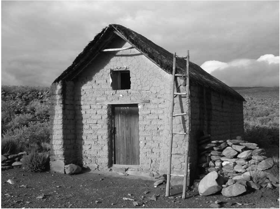
Figura 5: Oratorio en Rinconada, con sus muros en avance que conforman la antecapilla, y la ventana por encima del acceso.

Anales del IAA #48 (1) - enero / junio de 2018 - (65-81) - ISSN 2362-2024