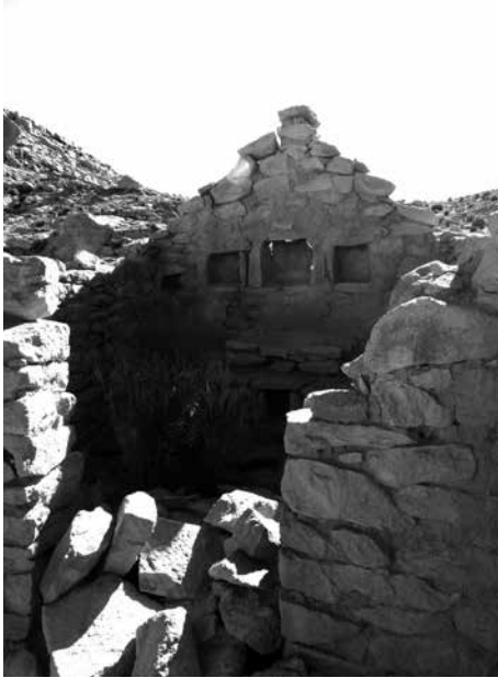
Figura 8: Tratamiento del muro testero en un oratorio destechado en Coranzuli.