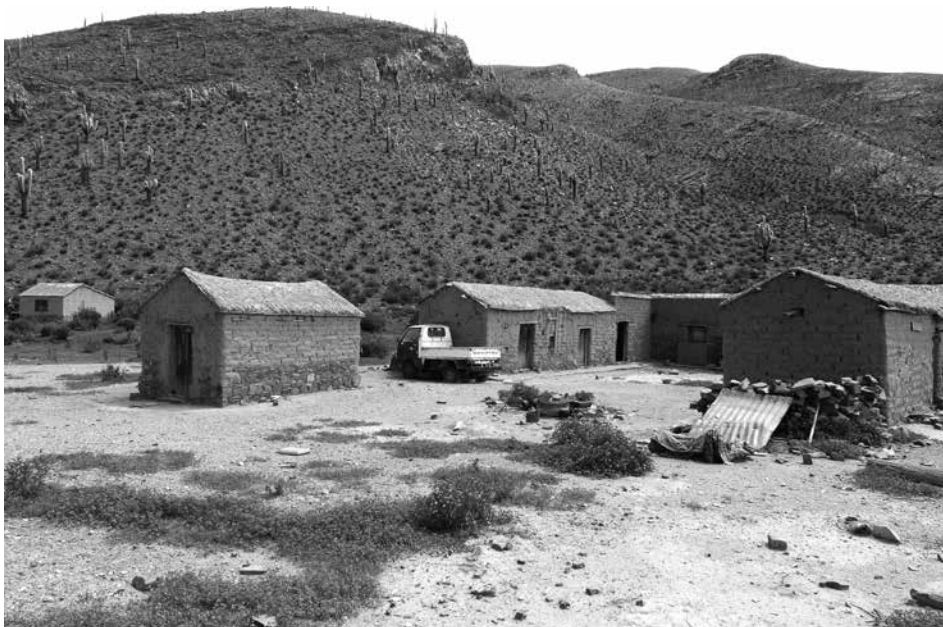
Figura 12: Oratorio integrado al patio en un domicilio de Susques.