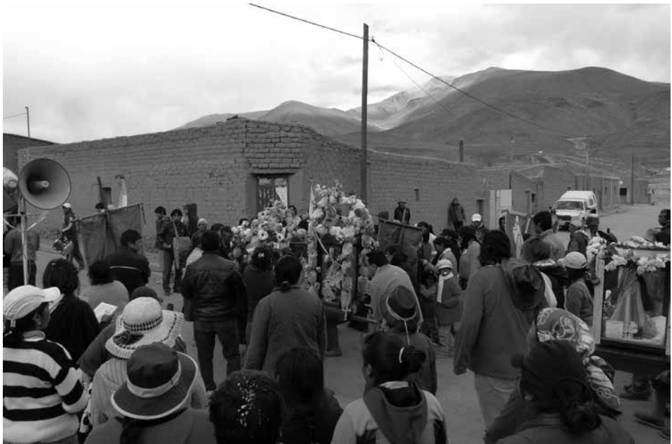
Figura 2: Procesión de la virgen del Rosario en Coranzulí, con la imagen de la Patrona acompañada por los santos y otras vírgenes.