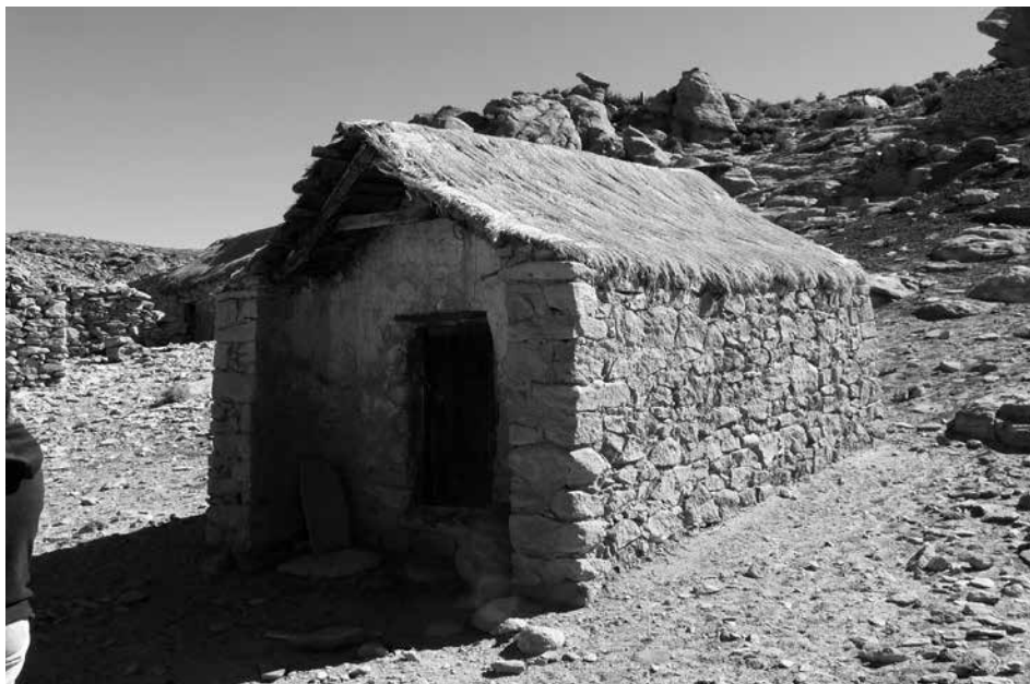
Figura 3: Oratorio en las cercanías de Coranzulí, sección Agua Delgada.