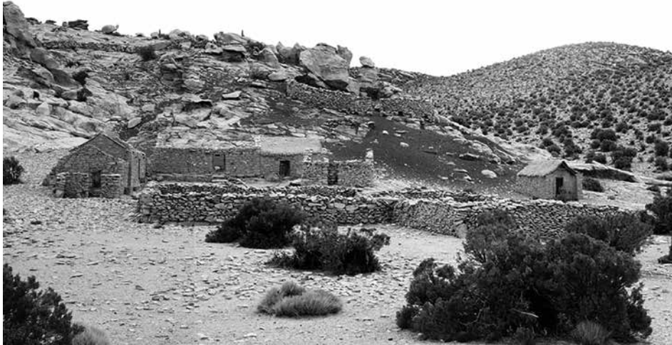
Figura 11: Oratorio en un domicilio en las cercanías de Coranzuli.