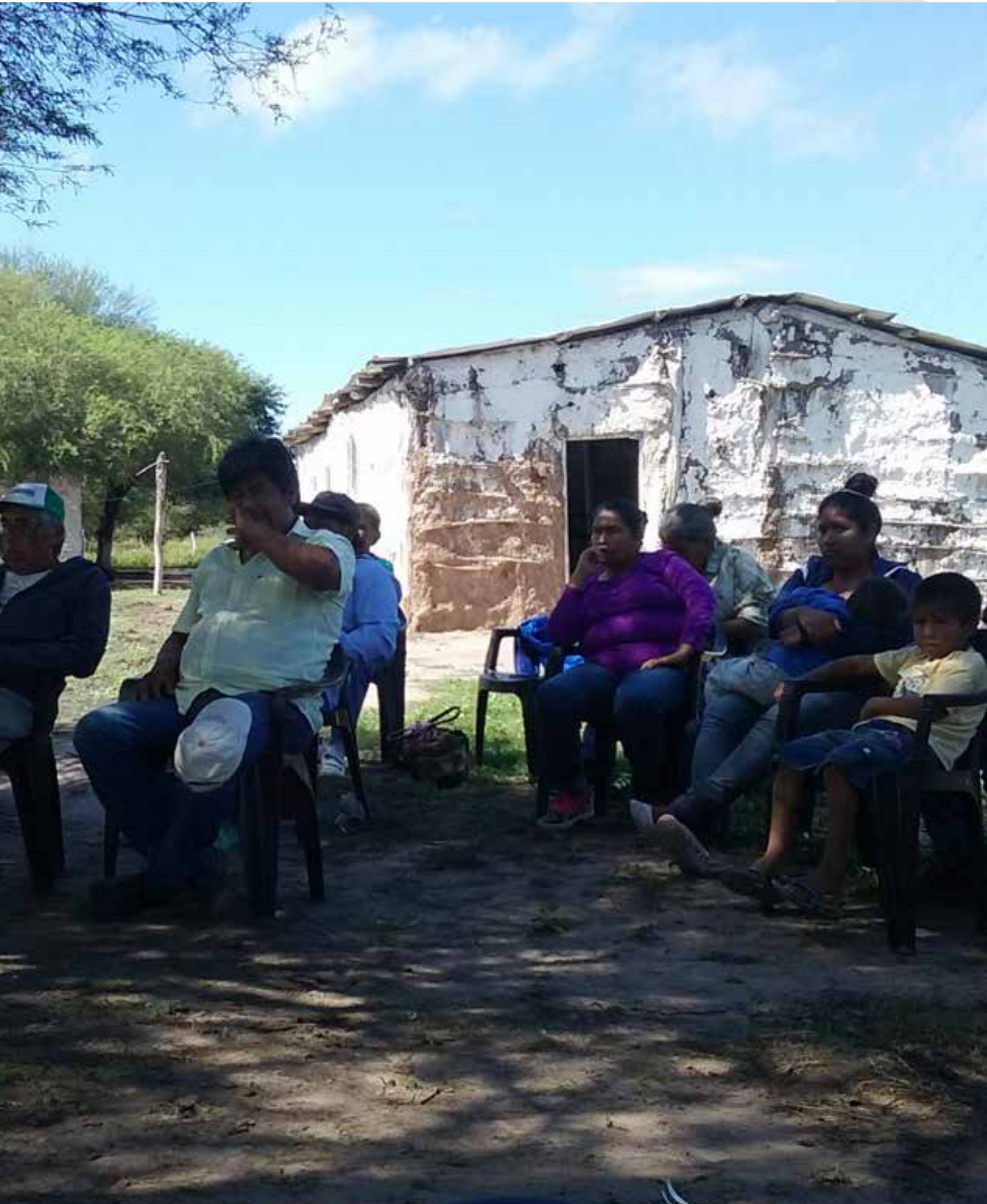
Reunión entre comunidad indígenas y ONG.