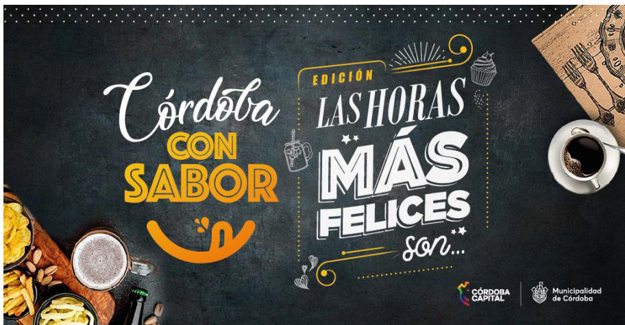
Figura 3 Córdoba con Sabor