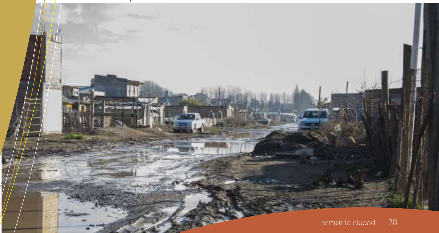
Tomas de tierra en Cipolletti.

De acuerdo a diferentes estudios, el consumo de suelo por habitante de los últimos 20 años en Argentina ha sufrido un fuerte crecimiento. Las tendencias recientes en los procesos de expansión urbana conllevan una mayor dificultad de los gobiernos locales para proveer