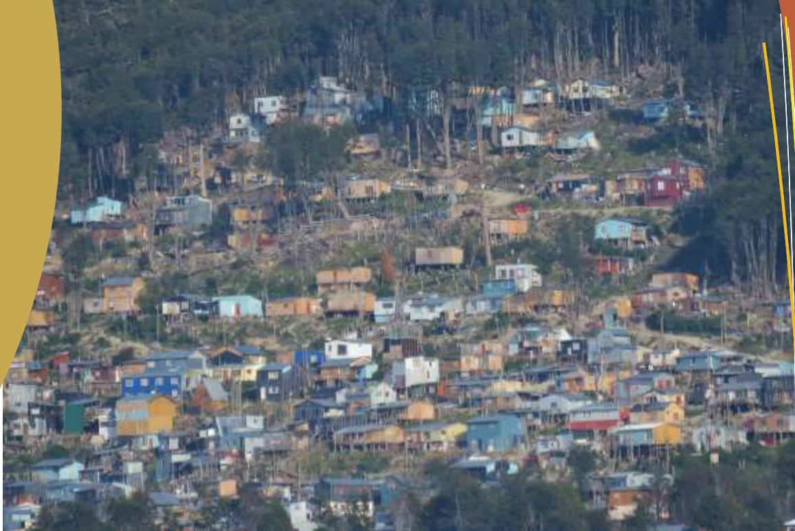
Área de expansión urbana en Ushuaia.

La extensa bibliografía sobre políticas de vivienda y la práctica en sí, ya han ampliamente demostrado que el déficit habitacional no se resuelve meramente con la construcción masiva de viviendas. Es necesario contar con planes integrales que contemplen los aspectos territoriales, ambientales, socio-económicos, normativos y de gestión urbana. Dentro de esas consideraciones, incidir sobre la variable del suelo urbano, sobre todo en contextos de especulación inmobiliaria, es clave para garantizar el acceso de la población a condiciones habitacionales dignas.