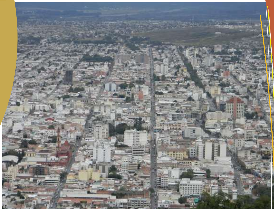
Ciudad de Salta