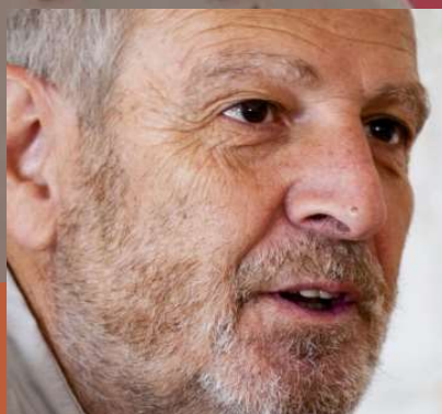
Salvador Rueda Urbanismo ecosistémico