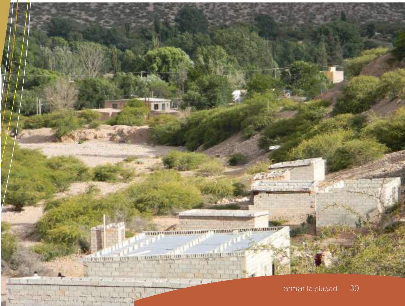
Asentamiento informal en Humahuaca