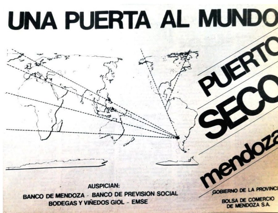
Figura 2. Anuncio publicitario en Diario Mendoza.

En la actualidad, en el Corredor Bioceánico Central se suman y complementan redes camineras, sistemas ferroviarios y ríos navegables. El paso cordillerano Cristo Redentor, encuentro del sistema de la Ruta Argentina N° 7 y de la Chilena N° 60, es la histórica, actual y operable vinculación de un gigantesco espacio económico cuyo hinterland comprende el sur de Brasil, pasando por Paraguay, Uruguay y todo el noreste argentino hasta, lógicamente, las economías regionales de Cuyo. Mientras que su foreland incluye Centro y Norte de América, Oceanía, Asia, África y Europa, tal como lo comunicaba el gobierno provincial en 1986 con la inauguración de las obras de la Zona Primaria Aduanera (Figura 2).