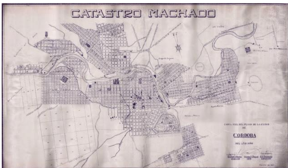
Figura 2. La ciudad de Córdoba en 1890

Elaborado por el Agrimensor Ángel Machado en base a un relevamiento catastral hecho en 1889. Municipalidad de Córdoba, Argentina