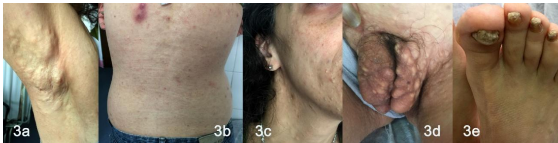
Foto 2: Caso 2. Mujer de 44 años. a y d. esteatocistomas en región axilar y vulvar, b y c. múltiples quistes pilosebáceos de distribución generalizada. e: distrofia hipertrófica de las 20 uñas, cromoniquia.