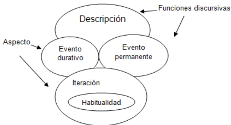
Diagrama 2. Prototipo del PI

Retomando la noción de Gramática Emergente propuesta por Hopper (1988), la metodología que implementamos para