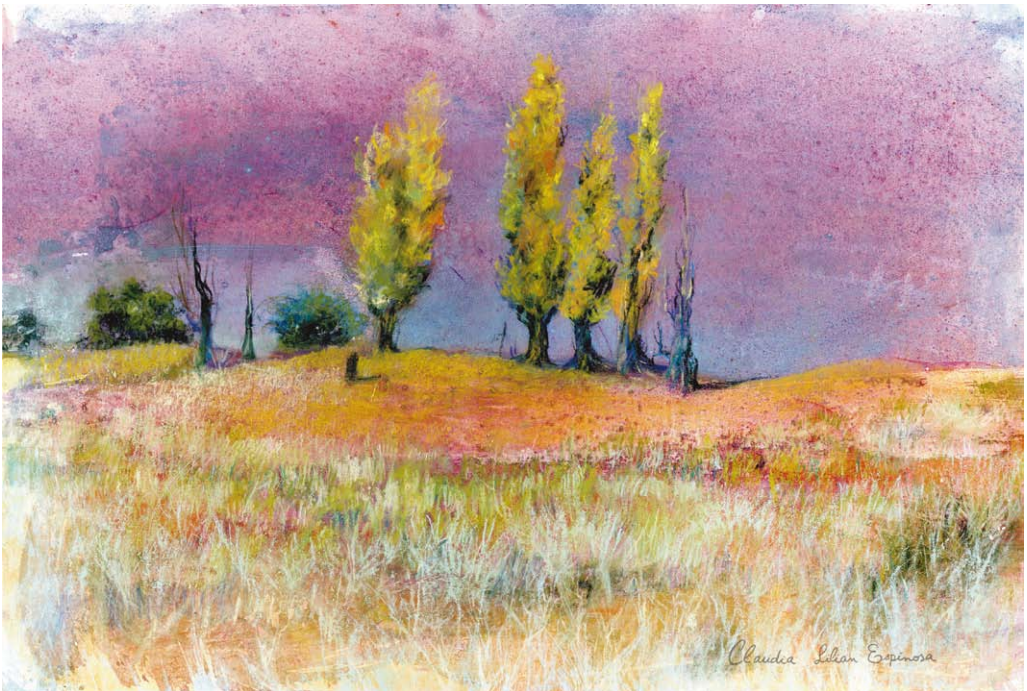
"Olivillos del medanal", mix technique. Claudia Espinosa

Received: January 25th, 2018 First Reviewed: February 27th, 2018 Second Reviewed: March 3rd, 2018 Accepted: March 3rd, 2018