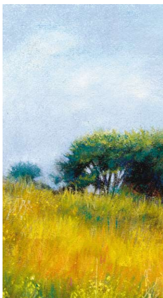
Detalle "Perfil de monte", técnica mixta. Claudia Espinosa