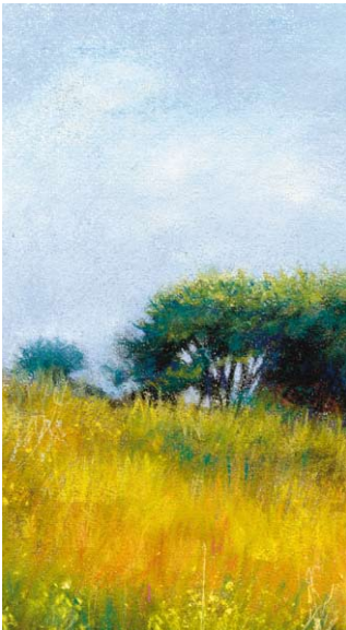
Detail "Forest landscape in La Pampa", mix technique. Claudia Espinosa