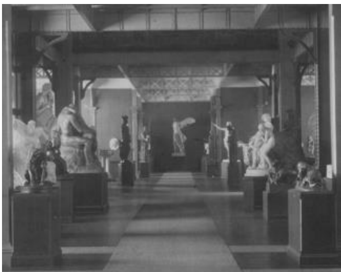
Fig. 3. Bellas Artes. Salón a la derecha de la entrada, y en el que se exhiben obras de autores extranjeros. 1910. Fragmento de fotografía.

Schiaffino ya no era director del museo al momento de la inauguración, mas el siguiente director, Carlos Zuberbühler, no realizó grandes modificaciones en la distribución museográfica (Melgarejo, 2011). Más allá de que no se había comprado la proa como pedestal, se puede notar que la disposición de la escultura da cuenta de un intento de reproducir las escaleras Daru 7 , especialmente gracias al despliegue del alfombrado que desde el punto de vista en que fue tomada la fotografía forma una línea de perspectiva que fuga hacia la escultura y por la inclusión de un pedestal que elevaba la pieza.