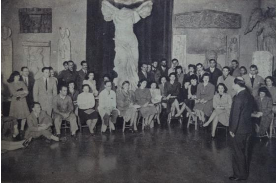
Fig. 6. Clase de estética en el museo de calcos. En Escuela Superior de Bellas Artes. Estética, La Nación , 8 de octubre de 1944.

las clases es el museo de calcos, ante lo cual se puede inferir que ese era su espacio representativo [fig. 6].