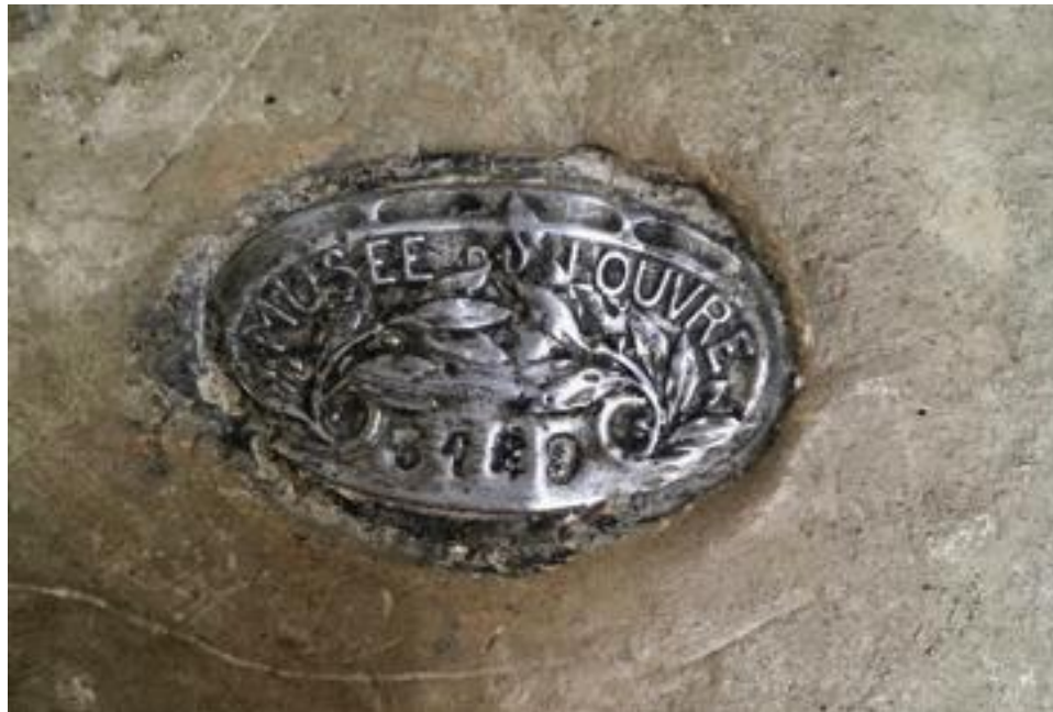
Figs. 1 y 2. Musée du Louvre. Victoria de Samotracia . Ca. 1900-1906. Vaciado en yeso. Museo de Calcos y Escultura Comparada Ernesto de la Cárcova; Musée du Louvre. Plaqueta del Musée du Louvre del calco de la Victoria de Samotracia . Ca. 1900-1906. Museo de Calcos y Escultura Comparada Ernesto de la Cárcova, Buenos Aires.

Una vez producidos en el ámbito del taller de vaciados, los calcos comenzaban su vida objetual en un contexto caracterizado por un alto grado de mercantilización: en los catálogos de ventas de esos talleres y en sus tiendas. Por ejemplo, en un catálogo publicado en 1891 en Nueva York por parte del Metropolitan Museum of Art, se recomendaba que el calco de la Victoria de Samotracia fuese adquirido en el Louvre (número de catálogo 134) por la suma de 300 francos. También, se ofertaba la base con forma de proa (número de catálogo 136) por 600 francos (Metropolitan Museum of Art, 1891: 30) 3 . De esta forma, el taller del Louvre funcionaba como una marca que le daba legitimidad a la copia adquirida. Esto era explicitado a través de la incorporación de una estampilla y una plaqueta, inclusión obligatoria a partir del Segundo Imperio (1852-1870), como una estrategia de prevención de falsificaciones y copias