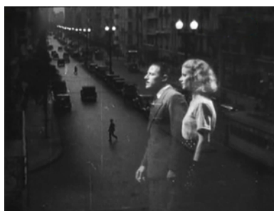
Figura 2 ( Escala en la ciudad )

Avenida de Mayo hasta llegar a las luces de la calle Corrientes con sus carteles de neón.