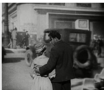
Figura 3 ( Sunrise )