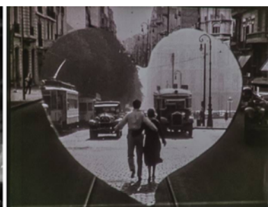
Figura 4 ( Muñequita porteña )

Como sostiene Patrick Keating (2016), el motivo visual de los personajes atravesando la calle ( the crossing-the-street shot ) es una estrategia a la que recurrían los cineastas de Hollywood para expresar la ambivalencia entre el orden y el caos de la vida moderna. En este sentido, la secuencia que filman Zavallía y Alton es muy similar, por ejemplo, a lo que habían hecho F. W. Murnau y su fotógrafo Karl Struss en Sunrise (1927) (fig. 3), paradigma cinematográfico de la oposición ciudad-campo. Pero no era la primera vez que el cine argentino tomaba este recurso. El propio Alton ya había filmado en Los tres berretines la famosa secuencia de apertura que muestra a la ciudad en su esplendor moderno. Un ejemplo todavía más claro por la similitud visual es el final de Muñequita porteña (1931). Aquí, José Agustín Ferreyra y el director de fotografía Gumer Barreiros registraban la transformación de Buenos Aires a la manera de las sinfonías urbanas de la década del veinte y terminaban en un último plano con la pareja romántica caminando por el medio de Avenida de Mayo, plenamente integrada a la ciudad (fig. 4). A diferencia de Escala en la ciudad donde el centro nocturno es un lugar hostil para la pareja, en estos registros diurnos de la vitalidad y movilidad porteñas los personajes hacían suya la ciudad.