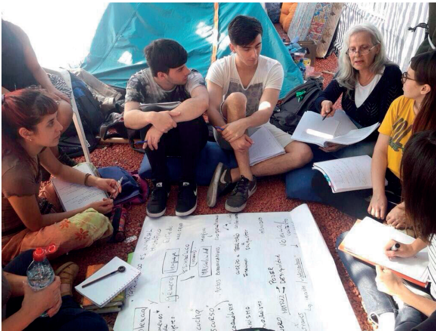
Imagen N.º 1: Fotografía tomada durante una clase de grado de la carrera de antropología en la carpa instalada frente al Congreso de la Nación en 2017.

Durante varias semanas, organizaciones indígenas, representantes y dirigentes de los pueblos originarios del país instalaron una carpa donde se realizaban las múltiples actividades y acampaban algunos de sus referentes. En la carpa, las actividades fueron diagramadas y planificadas por los propios integrantes indígenas. Podemos destacar de las diversas acciones, las reuniones y encuentros que llevaron adelante los líderes y dirigentes con senadores y diputados en días previos y en los mismos encuentros en que se trataba la Ley en comisión; la proyección de películas y documentales respectivas al tema en cuestión; la realización de campañas de difusión sobre la necesidad de darle tratamiento a la Ley en las redes sociales, fundamentalmente, pero también en los medios de comunicación; los abrazos al congreso y las movilizaciones; entre otras. La carpa funcionó, durante este periodo, como el lugar de trabajo y estudio de muchos integrantes de la Facultad de Filosofía y Letras y de la Carrera de Ciencias Antropológicas de la Universidad de Buenos Aires. Tal es así que no solo encontrábamos investigadores sino también docentes y estudiantes realizando clases públicas junto a los dirigentes indígenas en dicho espacio [Ver imagen N.º 1].