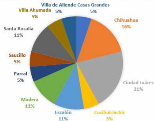
Figura 4. Salas del Circuito Alcázar en Chihuahua.

Por otra parte, como establece Serna (2009), las salas cinematográficas en la frontera México-Estados Unidos fueron un emprendimiento temprano llevado a cabo por empresarios de habla inglesa; sin embargo, la autora destaca que la circulación de los mexicanos es lo que permitió que se instale una cultura cinematográfica para los hispanos allí residentes. La movilización en pos de la instalación de salas en regiones fronterizas responde a dos factores principales: en primer lugar, el interés de responder a las necesidades de los nuevos habitantes de las ciudades que se desplazaron hacia el exterior o pasaron a un nuevo estilo de vida en su propio lugar en torno al crecimiento de la urbanización, y en segunda instancia, la búsqueda de nuevos mercados por parte de Estados Unidos en torno al avance del cine en América Latina. Las proyecciones de películas nacionales en territorio extranjero acompañarían también la estrategia estadounidense de la realización de versiones hispanas de sus films para ganar un mercado externo; sin embargo, esto no sería sumamente provechoso para ellos, a menos que las exhibiciones fueran realizadas por cinematografistas provenientes de Estados Unidos. En este caso, los Calderón, junto a Salas Porras, serían los agentes que desde México capturarían ese mercado en la frontera.