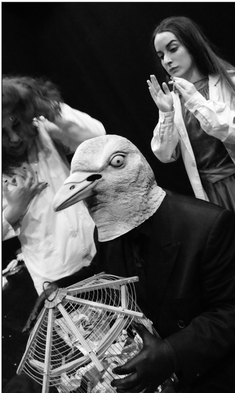
La imaginación al poder, Teatro Acción. Buenos Aires, 2018.

tas poéticas puede observarse, además, en la práctica del entrenamiento y en la formación del actor (la de cada uno de ellos y la de sus discípulos, en el caso de Gilio).