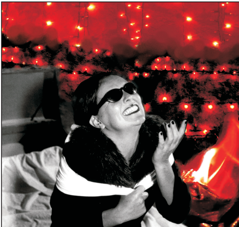
Elegía a Lola Mora, Teatro Acción. Isla de Creta, 2004.

Así como el comportamiento extra-cotidiano del actor puede revelar las tensiones escondidas bajo el diseño de movimientos, el espectáculo puede ser la representación, no del realismo de la historia, sino de su realidad , de sus músculos y sus nervios, de su esqueleto y lo que sólo se ve en una historia descarnada: las relaciones de fuerza, los ímpetus socialmente centrífugos y centrípetos, la tensión entre libertad y organización, entre intención y acción, entre igualdad y poder (Barba, La tierra de cenizas 150).