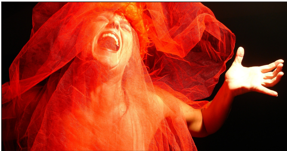
Escaleras, espirales y otros sueños, Teatro Acción. París, 2007.

texto, un acontecimiento fundamental para que se conocieran los rudimentos de su poética y comenzaran a aclararse los malentendidos. Ello por cuanto sus conferencias y entrevistas brindaron un panorama más certero acerca de su modalidad de trabajo y su modo de entender el teatro, pero también porque su presencia significó un estímulo directo para actores, grupos teatrales y directores que se identificaban con inquietudes artísticas similares.