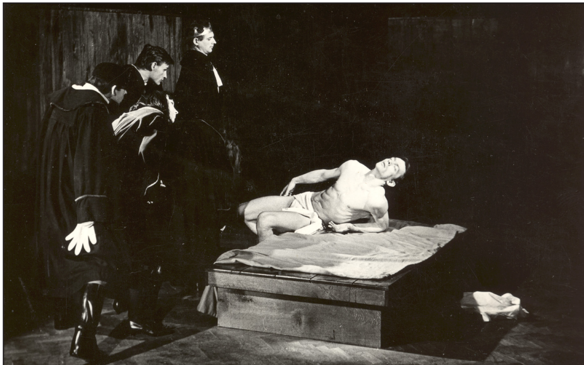
Primera versión de El príncipe constante . Breslavia, 1965.

Sus “descubrimientos” se tocaban ya la cola con el peor naturalismo-expresionismo (extraña combinación), transpiraban todos como condenados –siendo pleno invierno– y jadeaban al punto de no salirles ya la voz con la consecuente sobreactuación. Era a todas luces la simple muestra de actores muy exigidos físicamente, pero cuyo entrenamiento no llegaba a cubrir semejante ritmo, totalmente artificial [...]. Nada de todas esas carreras y gesticulaciones partía de una verdadera concentración y de una nueva expresividad como a través de la teoría suya se pretendía demostrar. Nada más lejos de una revolución teatral (15).