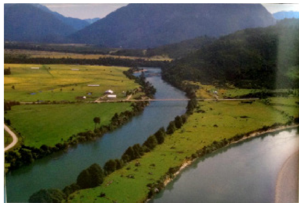
Autor: Georges Munro. (1990). Carretera Austral. El paraíso está aquí.

George Munro es quizás el fotógrafo profesional chileno que más obras ha dedicado al Camino Longitudinal Austral 1 . Su trabajo puede comprenderse como un registro visual del proceso de transparentización de Patagonia-Aysén, pero no solo como representación sino también como presentación o producción del mismo puesto que con el decreto N° 168 de 1982 por el cual el ministerio de Educación declaró material didáctico para las escuelas chilenas su primer libro dedicado a la ruta austral, titulado “Carretera Austral: integración de Chile” y en el contexto de la denominada “franja cultural” de la dictadura chilena (1973-1990), las fotografías de Munro adquirieron el estatuto de imagen oficial a exhibir y, por ende, como “objeto de paisaje” cuya materialidad no es (solamente) exposición de un referente sino creación de una nueva realidad (DELLA DORA, 2009).