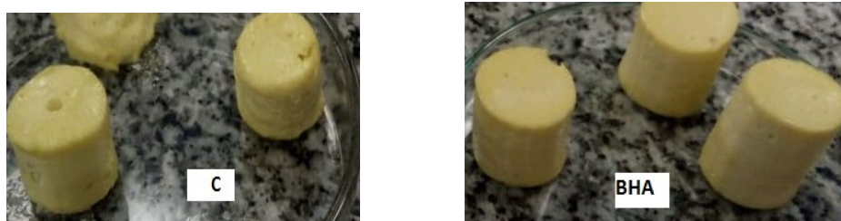
Figura 1: Aspecto de las emulsiones gelificadas con harina de garbanzo

La figura 1 , muestra el aspecto las emulsiones gelificadas (EG) obtenidas con harina de garbanzo (HGb), aceite de lino, agua destilada y gelatina (G) como agente gelificante, con las concentraciones mínimas de gelificación. El color de las muestras es similar al de la harina de garbanzo, esto es esencial en el desarrollo de sustitutos de grasa ya que es uno de los factores determinantes en la elección de alimentos por parte del consumidor.