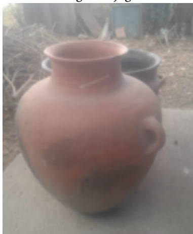
Figure 3. Jug