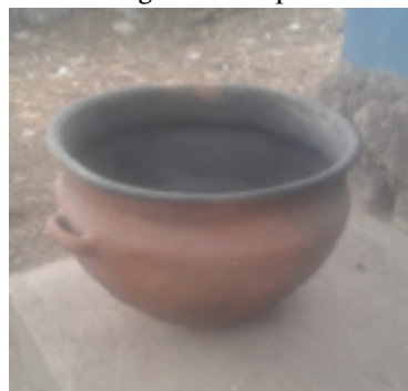
Figure 4. Virque