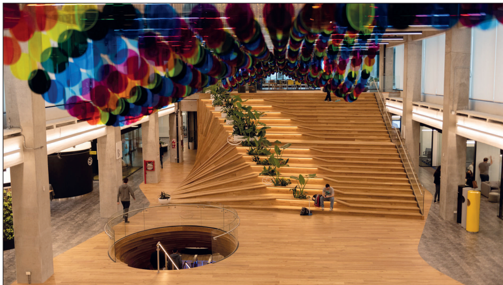
Imagen 2. Vista desde el primer piso de nuevas oficinas de Mercado Libre

Estas nuevas oficinas expresan de la mejor manera la visión del mundo que Marcos Galperin quiere transmitir a través de su empresa Mercado Libre. Se imponen como protagonistas de esta estructura espacial los “links o puntos de interconexión”, una gran escalera de madera en sintonía con una especie de hueco que conecta todos