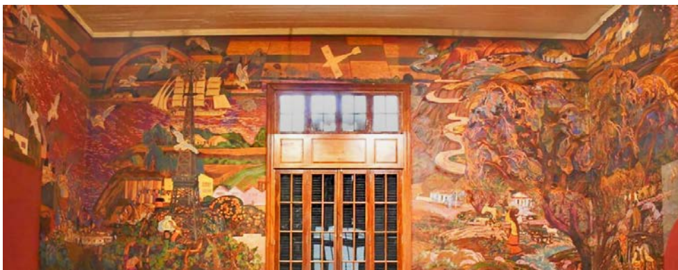
Figura 1. Uno de los cuatro muros de la tela para la «Exposición Iberoamericana de Sevilla» (1928), Alfredo Guido

La elección de Guido de cómo mostrar lo nacional fue a través del paisaje, con colores saturados y pinceladas sueltas. En su tela, que cubría las paredes del pabellón, se van sucediendo distintos paisajes amalgamados en uno solo; representa el campo, el litoral con el delta y los barcos; el puerto con los silos; la pampa húmeda y zonas más boscosas [Figura 1]. Están ausentes de su pintura la Patagonia, así como la cordillera. Dentro del paisaje se ven algunos hombres y mujeres junto con los animales que pueblan el suelo.