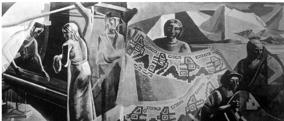
Figura 3. Las Industrias Artesanales, «Exposición Internacional de París» (1937), Lino Enea Spilimbergo. Crédito: Spilimbergo (1999), de Guillermo Whitelow, Fermín Fèvre y Diana Wechsler

el paisaje al tiempo que representa un patrón con cóndores cuyos picos se enlazan con la cola del siguiente. Otros motivos andinos que aparecen son el tukapu y el caxane, que se pueden encontrar en dibujos y diseños incas. 7 Es probable que el artista haya tomado una serie de símbolos andinos y creado su propio diseño para representar la cosmovisión andina [Figura 3]. Este tipo de aproximación al paisaje y sus pobladores presentaba una suerte de esencia americanista, que se pretendía más pura y no contaminada por el cosmopolitismo de las ciudades (Amigo, 2014).