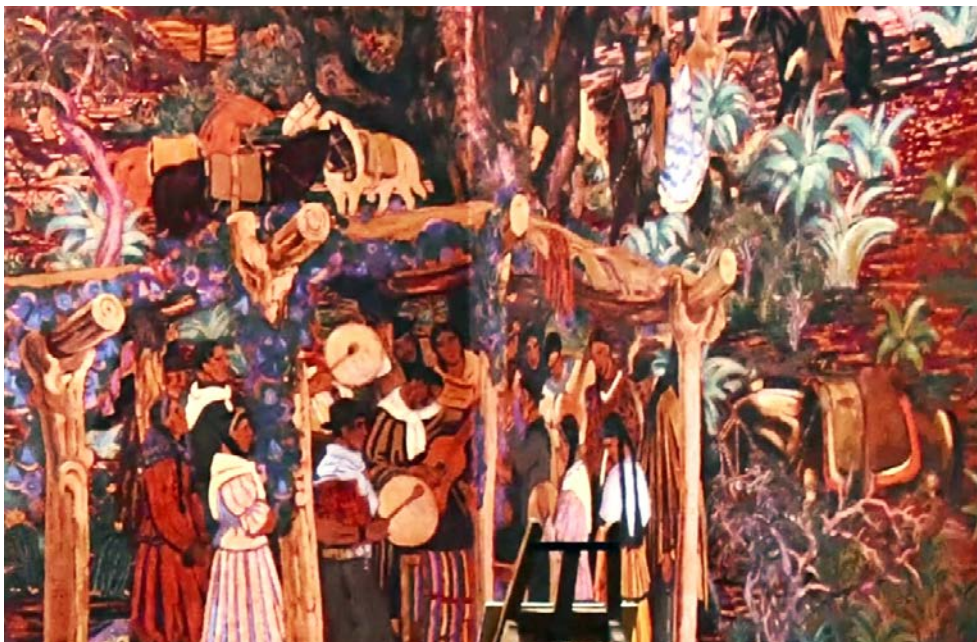
Figura 2. Detalle del mural para la «Exposición Iberoamericana de Sevilla» (1928), Alfredo Guido

Guido había realizado un viaje a Jujuy y, ya en sus obras más tempranas y en su participación en la revista de El círculo , se puede observar un interés por representar paisajes del noroeste argentino y del altiplano boliviano, como ha demostrado Adriana Armando (2004, 2014).