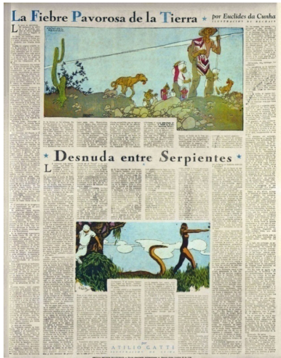
Figura 2 – Euclides da Cunha “La fiebre pavorosa de la tierra” RMS n° 12 (28 de octubre de 1933)

La fusión entre religiosidad y superstición estuvo presente también en la última versión que el suplemento ofreció de Os Sertões , titulada “Cómo se hace un monstruo”. Este relato comenzaba in medias res con puntos suspensivos, signos que abundaban en los primeros párrafos, enfatizando el carácter fragmentario de la historia: