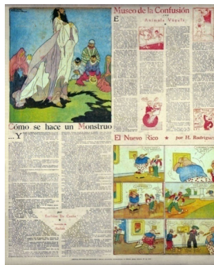
Figura 3 – Euclides da Cunha “Cómo se hace un monstruo” RMS n° 28 (10 de marzo de 1934)

Al igual que en los fragmentos anteriormente analizados, texto e imagen aclimataban la traducción al público local. 14 Mediante la implementación de voces testimoniales similares a las que habían integrado los reportajes del diario, se identificaba a los habitantes del sertão con los gauchos de Argentina: “Un viejo criollo detenido en Canudos en los últimos días de la campaña, algo me dijo a su respecto ” (1934, 7 cursiva mía).