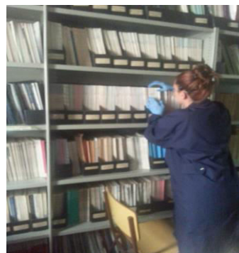
Figura 6: Sala Biblioteca

importante hemeroteca con más de 4000 volúmenes físicos que van en fechas extremas desde el año 1960 a 2004. Entre algunos de sus títulos se cuentan revistas, cuadernillos, procedings, etc. Por mencionar sólo algunas: Transaction on computer-human interaction hasta el año 2002; Ada letters de los años '90, los Proceedings of the Third International Workshop on real time, Ada Issues de los '80 y '90, Computación y Negocios de los '90; Communications ACM de los años '80 al 2000, Ieee publication catalog de los años '90, la Bibliography and Subject index of current computing literature de los años '60 hasta el año 1976; Computers & Society de los '80 hasta el 2000, el Noticiero SADIO de la década del '90, Expert de los ochenta y noventa, los Cuadernos de SADIO, Ieee transactions on knowledge and a data engineering de los noventa, el Journal of the Association for Computing Machinery del sesenta al ochenta, el Journal of the Operations Research Society of Japan del 69 al 2003; los