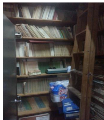
Figura 3: Cuarto cocina: izquierdo

(3) Cuarto de la cocina: izquierdo: Este espacio de 2,10 por 1,90 metros (4 m 2 ) sin ventilación más que la entrada y con luz artificial. Se encuentra hacia el fondo del piso, al lado izquierdo de la cocina de la sede, donde se guardan algunas vituallas de la institución, productos de limpieza y una escalera como también revistas, cajas y documentos ordenadamente. No se observan problemas de humedad a la vista. En la pared N° 1 se dispone de un mueble de metal con puertas (abiertas) de cinco estantes internos en el cual se guardan 24 cajas de plástico azul rotuladas JAIIO 18 a 40, posters y CD. En la pared N° 2 en 7 estantes de madera se disponen revistas, atados de revistas y una caja de comunicaciones repetidas 1982, en la pared N° 3 en 7 estantes de madera se disponen revistas, libros, cajas y una carpeta.