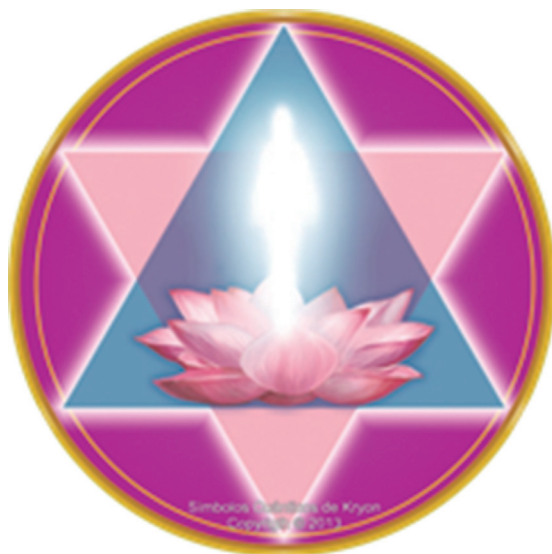
Imagen 04: Los Símbolos Cuánticos

(Registro de diario de campo de 15 de noviembre de 2015)