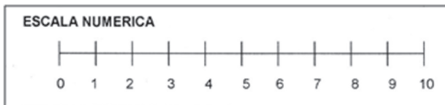
Imagen 02: Escala Numérica de Dolor

Fuente: Escaneada de una hoja de la historia clínica.