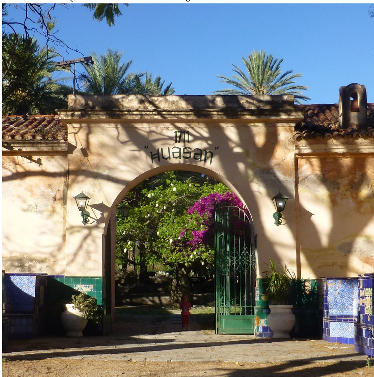
Imagen 1: Fachada actual de la antigua estancia de Santa Rita de Huasán

noviembre de 2018