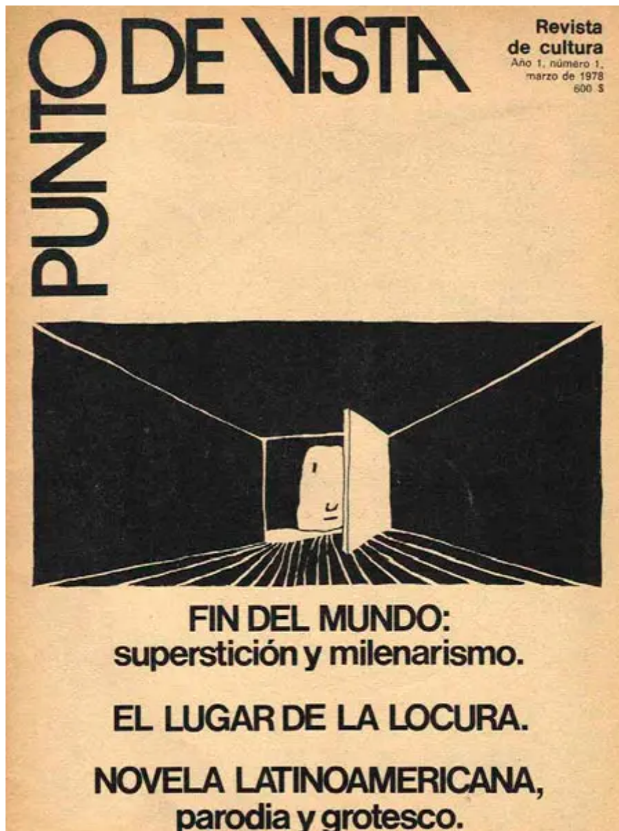
Tapa del primer número de la revista Punto de Vista.