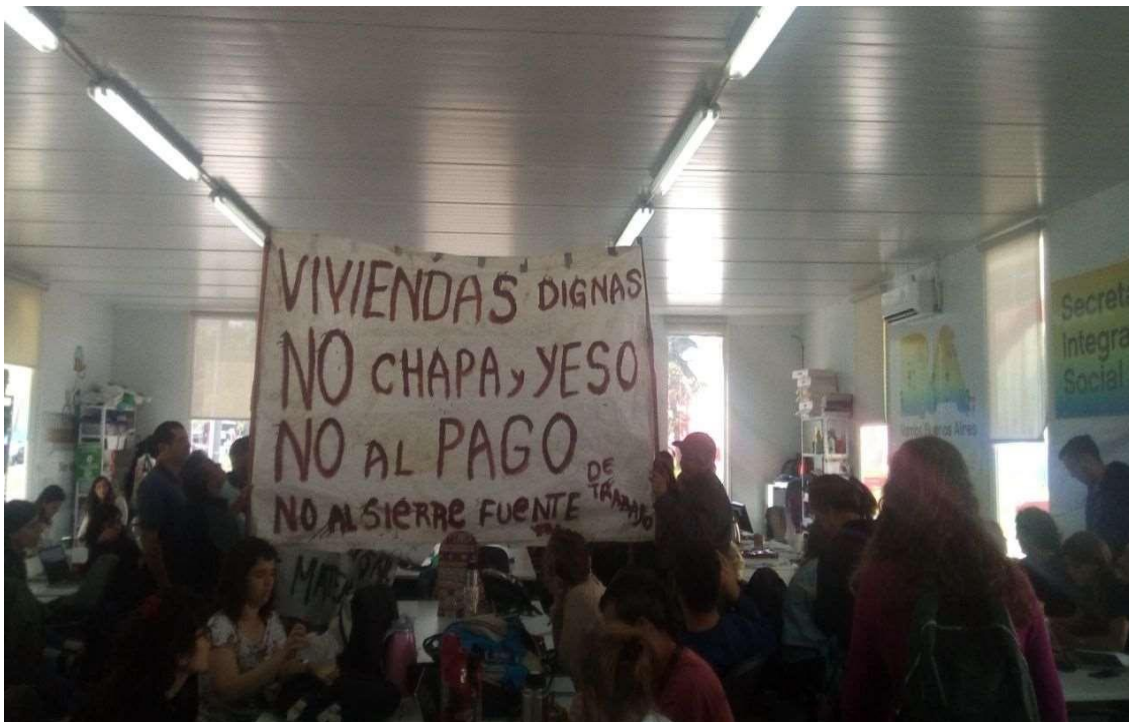
Imagem 7: Protesta de destinatarios de vivienda nueva tras visita a las unidades habitacionales. Containera, Villa 31-31 bis.