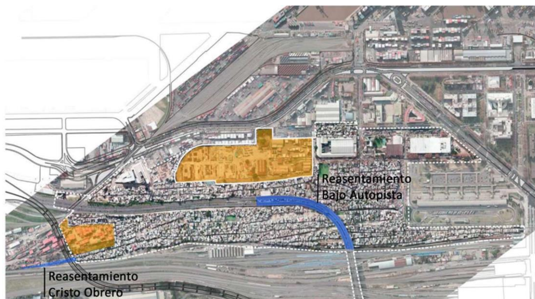
Mapa 3. Zonas a reasentar y localización de viviendas nuevas YPF y Containera.