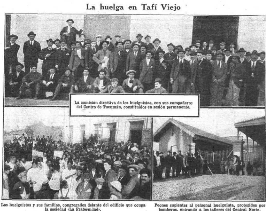
Imagen 4 “La huelga en Tafí Viejo”

En su racconto del conflicto, otro espacio destacado es la Estación, a la que incluye entre los escenarios nodales de la huelga por haberse desplegado la represión, acaecida el 5 de octubre de 1917. Ya desde el comienzo del paro general, las autoridades habían extremado los refuerzos policiales y movilizaron tropas del Ejército con el objeto de garantizar una custodia más eficaz de los establecimientos y de aquellos que continuaban trabajando. Esto último, en particular, suscitó demostraciones por parte de los huelguistas y sus familias quienes, apoyándose en la fuerza de su número, repudiaban a los rompehuelgas, por lo general en los alrededores de las estaciones. En estas circunstancias, ocurrieron algunos de los episodios más trágicos de la gran huelga ferroviaria de 1917, en las que se lamentaron varias víctimas como resultado de refriegas y enfrentamientos con las fuerzas de seguridad. Cruz traduce la intensidad de la represión,