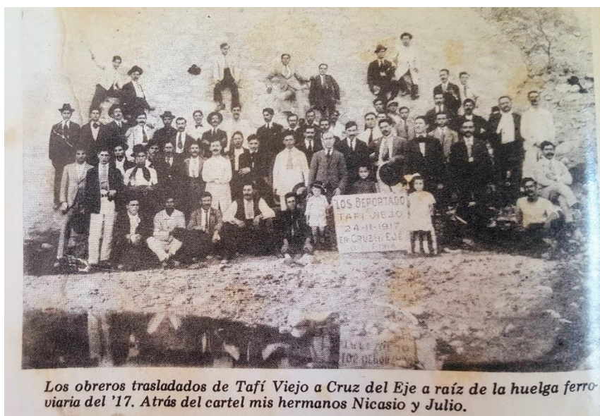
Imagen 5 Fotografía con la que Cruz Escribano ilustra el final de la huelga ferroviaria de 1917 y la consecuente separación de su familia.