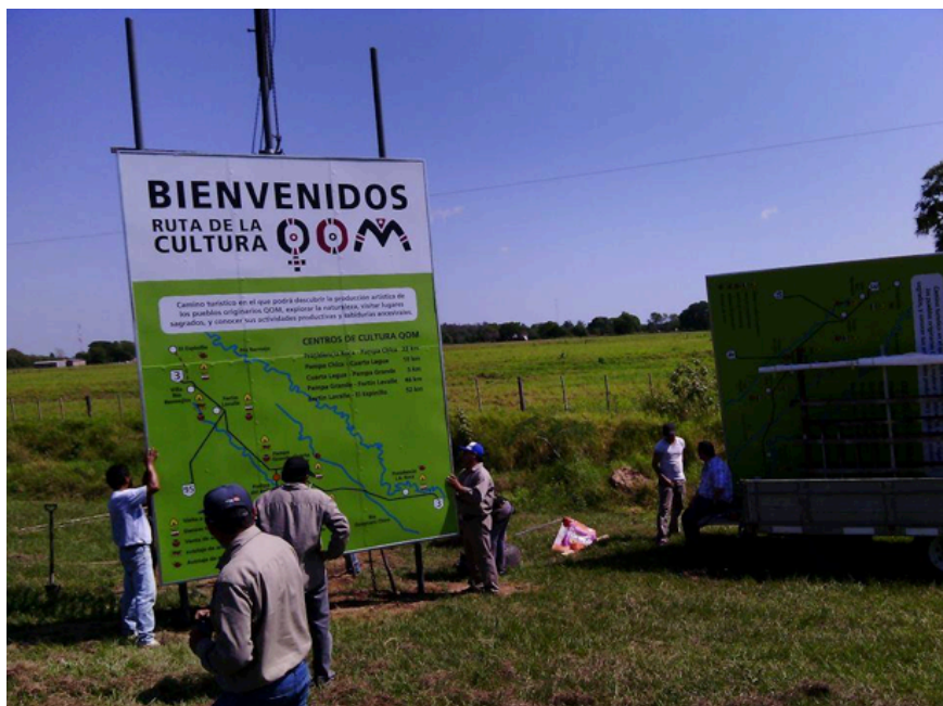
Fotografía tomada en el trabajo de campo de agosto 2017.

Imagen 3. Mapa realizado por las organizaciones étnicas de la localidad y reutilizado por el PPI financiado por el Banco Mundial, a partir de la implantación del proyecto RCQ.