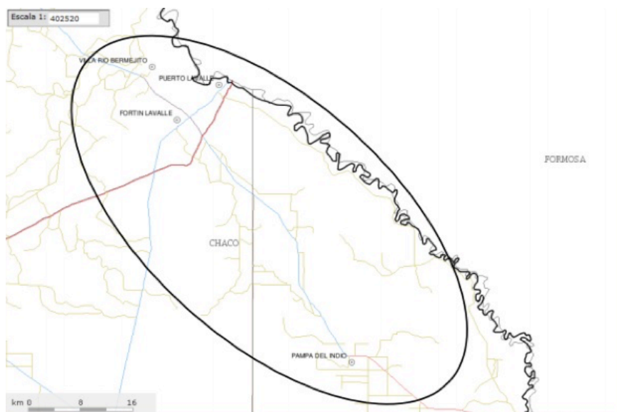
Imagen 2: En este mapa se puede observar un ovalo pequeño que da cuenta de la ubicación de la RP3 y un ovalo que lo contiene y que referencia el área de influencia del proyecto que considera a la región delimitada a lo largo de la RP4 y RP95.

Mapa disponible en: Informe de Impacto medioambiental, S.F.