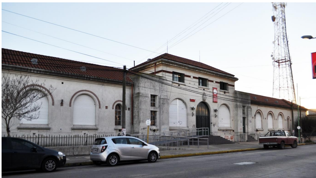
Figura 2. Escuela Normal “José Manuel Estrada” desde su fachada de la calle Belgrano.

En este contexto, la escuela adquiere un valor simbólico, en tanto forma parte de una red de escuelas normales creadas por el Estado nacional a principio de siglo XIX y fue la única escuela que formó docentes en la ciudad hasta el año 1969. También tiene un valor arquitectónico, en tanto su edificio, cuya construcción se inició en 1928 y finalizó en 1936 (Escuela Normal “José Manuel Estrada”, 2010), responde a un tipo de escuela desarrollada por el Estado para la época que sintetiza el proceso de exploración tipológica escolar pública de finales de la década de 1920. En orden de esta tipología, la escuela tiene un esquema cerrado y compacto de patios y galerías que ocupan la totalidad de la manzana donde se emplaza (ver Figura 2). Asimismo, presenta un estilo arquitectónico hispanizante (Arabito, 2009). Por último, el bien tiene un importante valor social, en tanto nunca perdió su función original y es hoy un hito urbano y un símbolo de educación pública de excelencia.