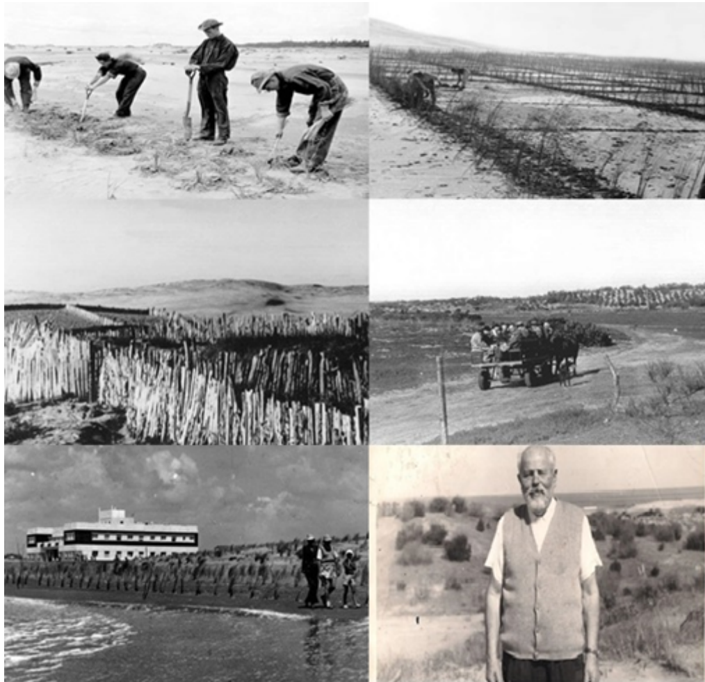
FIGURA N.º 3 Fijación de médanos en el actual Partido de Pinamar y Villa Gesell

Las imágenes pertenecen a las tareas de fijación de médanos llevadas adelante en un sector del área objeto de estudio. Sobre el margen derecho inferior una fotografía de uno de los pioneros de la región, Carlos Idaho Gesell.