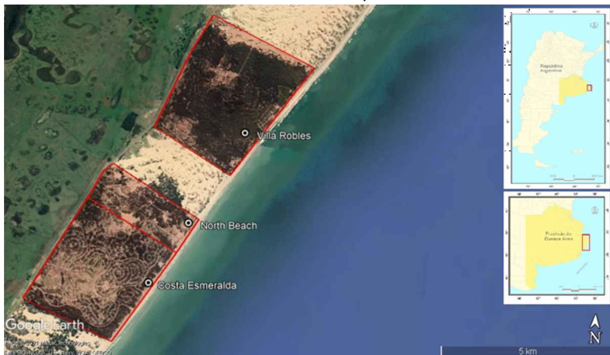
FIGURA N.º 4 Costa Esmeralda, North Beach y Villa Robles.

Los principales emprendimientos urbanos cerrados del Partido de La Costa.