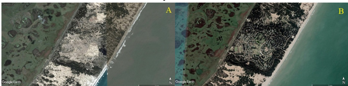
FIGURA N.º 2 Urbanización especial Costa Esmeralda

Cambios en el uso del suelo por urbanizaciones privadas. a) Superficie para 2006 que ocupa el emprendimiento privado Costa Esmeralda; b) Superficie ocupada por Costa Esmeralda en 2020.