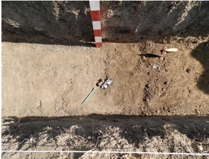
Figura 7. Señalizaciones luego del trabajo con detectores de metales.