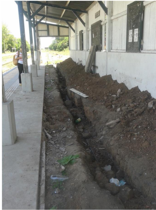
Figura 5. Zanja abierta en 2017 por operarios de una empresa en uno de los andenes de la estación de Olivera. En los sedimentos removidos se realizaron recolecciones de superficie.

Durante 2018, en el área del puente, abrimos las siguientes trincheras (Figuras 6 y 7):