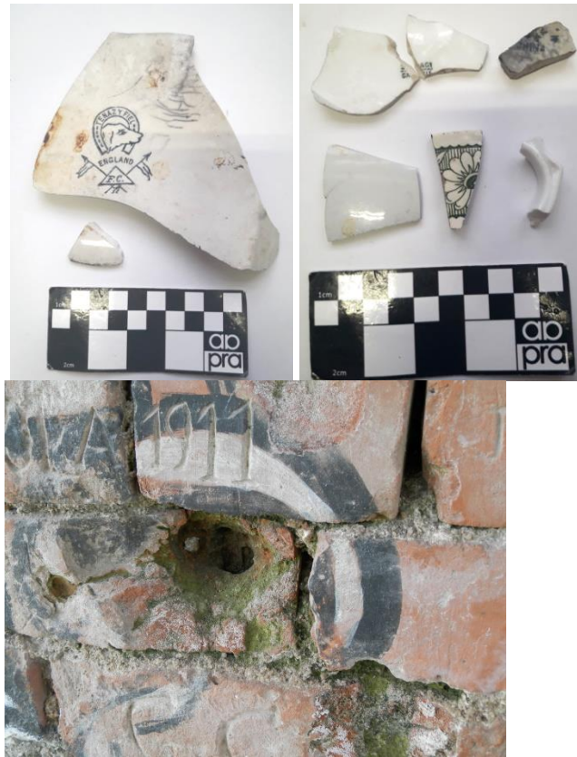
Figura 8. Algunos hallazgos generales: fragmentos de loza europea, impacto de bala, proyectil y grafitis en las paredes que sostienen el puente.

Vale destacar que recientemente, sobre la base de los estudios documentales y el relevamiento topográfico, hemos podido incorporar otras zonas de estudio para realizar trabajo de campo: 1. un área ubicada en una suave lomada, en donde se habría asentado el campamento de las tropas bonaerenses y 2. la Cañada de Arias por donde habrían realizado una apresurada retirada las fuerzas provinciales ante la embestida del Ejército nacional (Candela MS 2021).