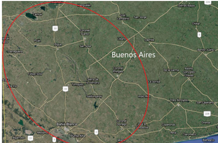
Imagen 1. Area de monitoreo de poblaciones de Lolium sp. (Vigna et al. , 2017)