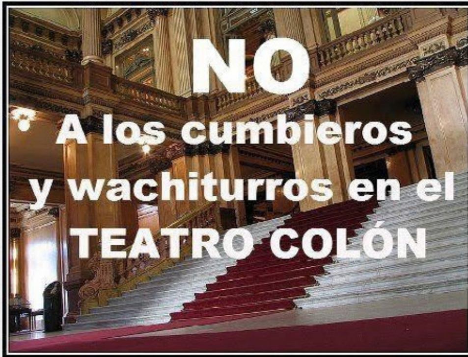
Figura 3. No a los cumbieros.

O el “no a los cumbieros y wachituros en el teatro Colón”: