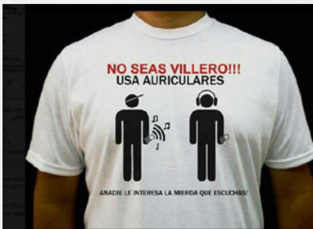
Figura 1. no seas villero.

O esta idea de comparar la partitura de Bach con el reggaetón diciendo “no le falte el respeto a la música”.