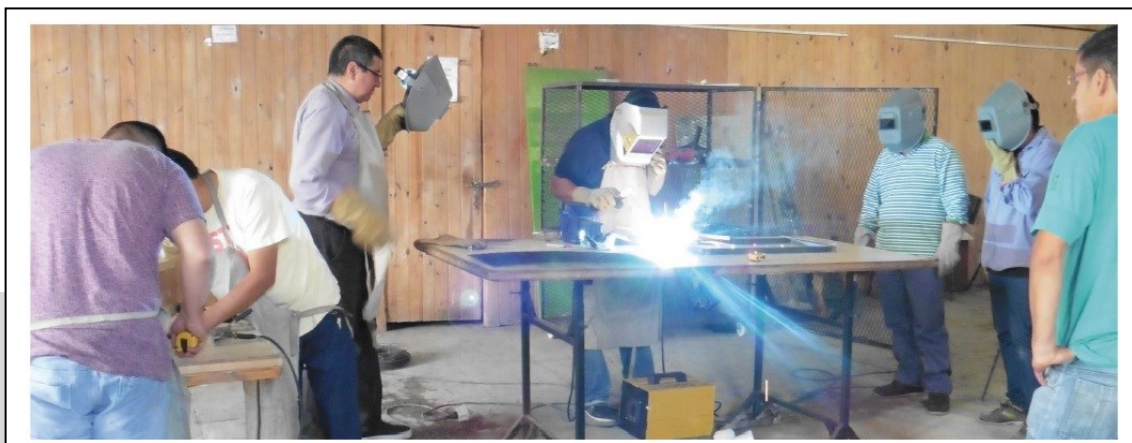
Imagen 2. Trabajadores durante la construcción del CIDAC.

Un ejemplo de esto resulta de la vinculación con el Ministerio de Trabajo y Seguridad Social, a partir de la cual se ejecutó el programa «Obra Pública Local» para la construcción del edificio del CIDAC. Mientras que desde el Ministerio se destinó financiamiento para la compra de materiales, la mano de obra para la construcción contó con la participación de doce vecinos desocupados del barrio de Barracas –perteneciente a diferentes organizaciones sociales de la zona– junto con un equipo de arquitectos [Imagen 2].