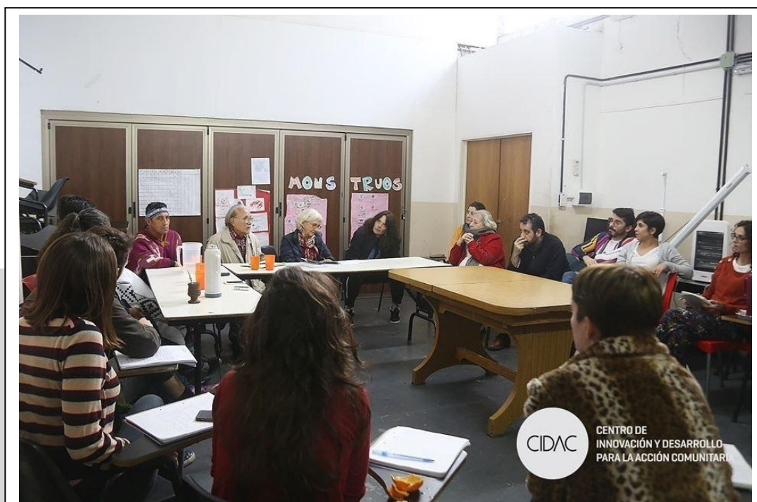
Imagen 3. Mesa redonda «Alianza con los pueblos indígenas para ejercer los derechos», realizada en el CIDAC en octubre de 2019.

La actividad tuvo lugar en la sede del centro, en el barrio de Barracas, durante la cursada del Seminario PST «Pueblos indígenas, organizaciones etnopolíticas en contextos de conflictividad». La mesa contó con invitados/as de diversos sectores y con el patrocinio de espacios científico tecnológicos –entre ellos, de la SEUBE, el Instituto de Ciencias Antropológicas de la FFYL, CLACSO, la Universidad de Lujan y la Universidad de Avellaneda– que garantizan la articulación de estos ámbitos de trabajo de extensión y de investigación. Cabe señalar que dichas actividades se financian a partir de diferentes proyectos de Universidad de Buenos Aires, Ciencia y Tecnología (UBACYT), Proyectos Universidad de Buenos Aires de Extensión (UBANEX) y Proyectos de Desarrollo Tecnológico y Social (PDTS), que tienen por objetivo la búsqueda de soluciones a problemáticas de carácter práctico, es decir, a necesidades sociales, económicas y políticas, entre otras, junto con los actores sociales.