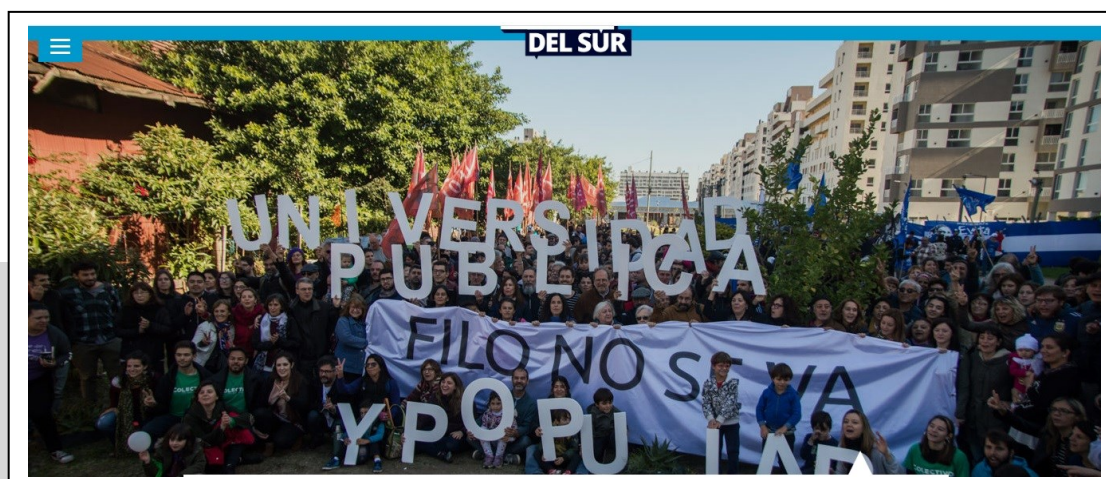
Imagen 4. Abrazo al CIDAC, en mayo de 2019, que con leyendas como «Universidad Pública y Popular» y «Filo no se va» mostraron la importancia del centro y su vinculación con el territorio.

E inmobiliaria, agregaremos nosotros. En este escenario, y con el riesgo de que el nuevo código de «espacio público» de CABA, busque desalojar al CIDAC para convertirlo en un «espacio verde», en mayo de 2019, la FFYL y diversas organizaciones sociales convocaron a un abrazo al edificio en el cual participaron diversos actores del barrio, la universidad, los sindicatos, y las organizaciones sociales y políticas, entre otros [Imagen 4].