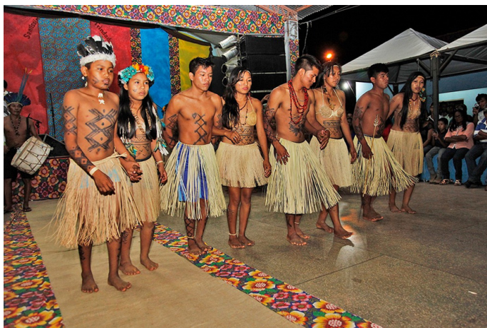
Chiquitanos de Vila Bela, 2013