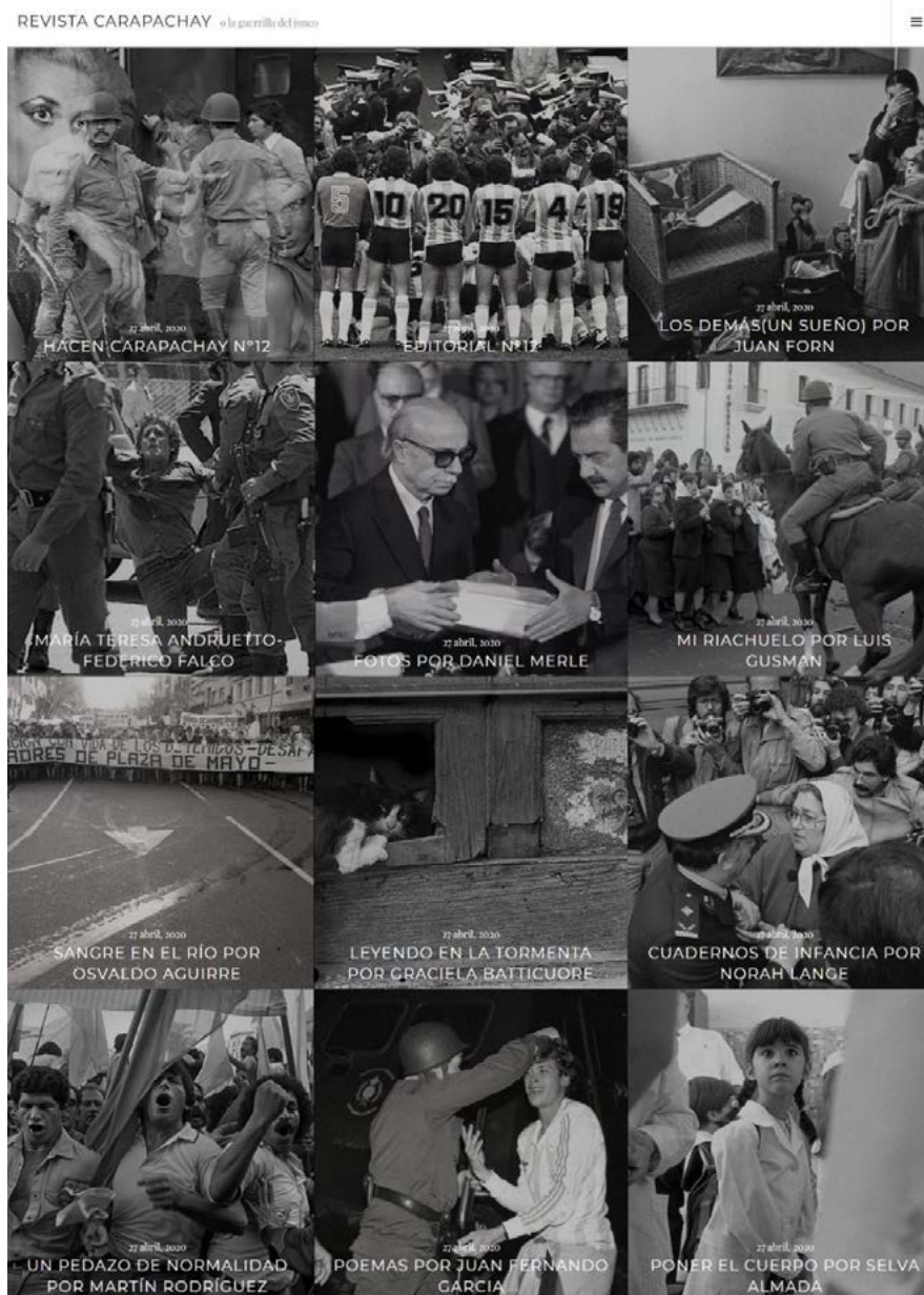
Figura 2. Páginas de inicio de Carapachay , con plantillas que ofrecen contenidos según novedad de aparición Figure 2. Carapachay home page, with templates that offer content according to new appearance

La periodicidad de Carapachay se estructura por números: para este caso, el 12, publicaron todos los textos el 27 de abril. Fuente: captura de pantalla del 12/05/2020. The periodicity of Carapachay is structured by numbers: in this case, the 12th, contains all the texts on April 27th. Source: screenshot from 15/05/2020.