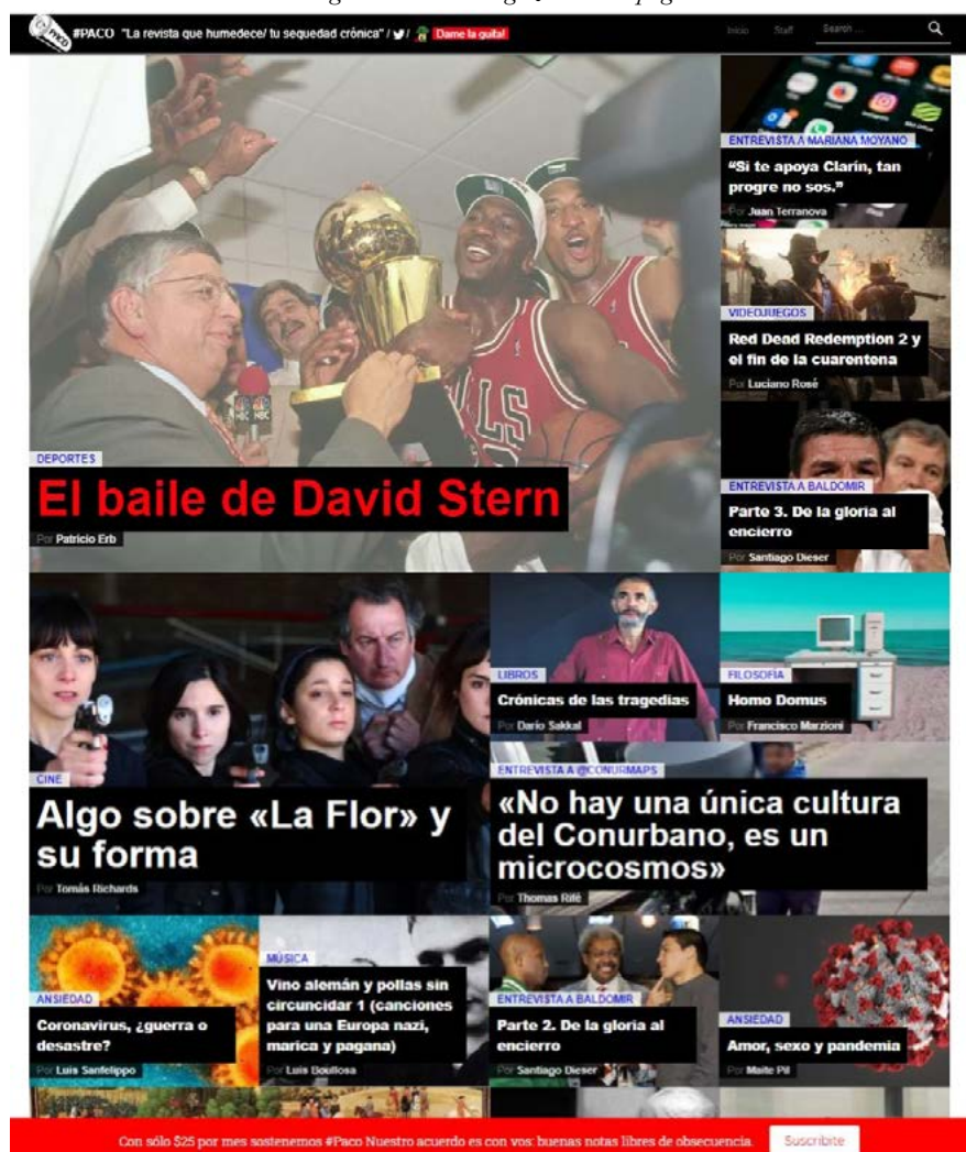
Figure 3. Paco magazine home page

Al pie de la página de inicio se explicita el sistema de suscripciones con la frase: “Con solo $25 por mes sostenemos #Paco Nuestro acuerdo es con vos: buenas notas libres de obsecuencia”. At the bottom of the home page, the subscription system is explained with the phrase: “With only $25 per month we support #Paco Our agreement is with you: good notes free of obsequiousness”.