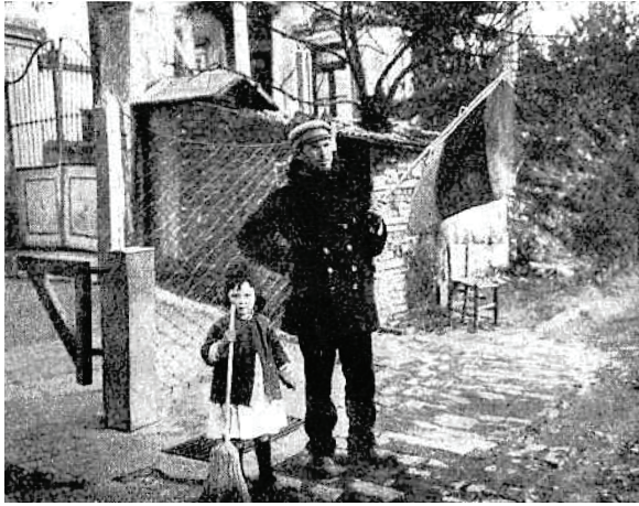
Figura 4. Guardavía en funciones, acompañado de su hija