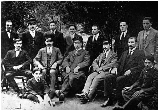
Figura 2. Personal de la estación Belgrano C. del Ferrocarril Central Argentino