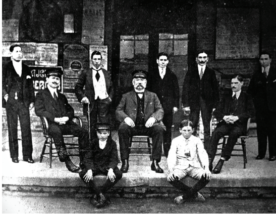
Figura 1. Personal de la estación Rafaela del Ferrocarril Central Argentino

Fuente: Revista del Ferrocarril Central Argentino (Buenos Aires) junio de 1915: 465.