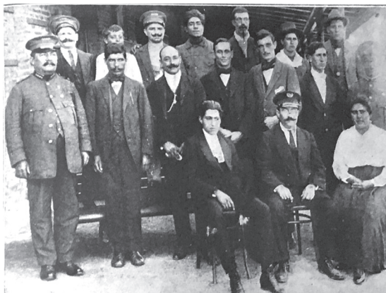
Figura 3. Personal de la estación Saira del Ferrocarril Central Argentino