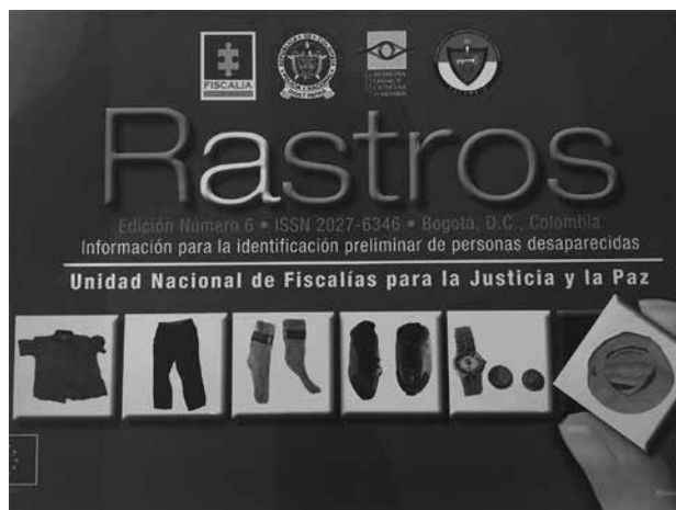
Fotografía 4. Revista Rastros , Fiscalía General de la Nación, Colombia.

Otra forma se advierte a partir de las prendas de vestir o artefactos personales de personas desaparecidas que pueden servir como vehículos para su búsqueda, identificación médico-legal y reconocimiento social (Guglielmucci, 2017). Por ejemplo, en las diligencias de exhumación realizadas por la Fiscalía General de la Nación de Colombia en más de 4.700 fosas encontradas en todo el país, los forenses no solo han desenterrado los restos corporales de personas desaparecidas sino también prendas, alhajas, zapatos, etc. Estos objetos que las víctimas llevaban cuando las asesinaron han sido empleados por los investigadores como un método útil para identificarlas. Las fotografías de las prendas de vestir y objetos personales hallados, preservados y registrados, son presentados periódicamente por la Unidad de Justicia y Paz de la Fiscalía en la revista Rastros y en su página web, en donde los familiares pueden hacer averiguaciones de lo que se ha encontrado en todas las regiones del país con el fin de reconocer alguno de ellos como distintivo de la persona buscada.