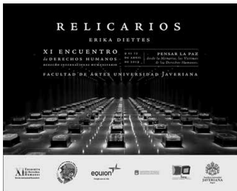
Fotografías 6, 7, 8, 9 y 10. Archivo Obra Relicarios , Erika Diettes. Fuentes: https://www.utadeo.edu.co/es/noticia/especiales/home/1/relicarios https://facartes.uniandes.edu.co/evento/exposicion-relicarios-de-erika-diettes/