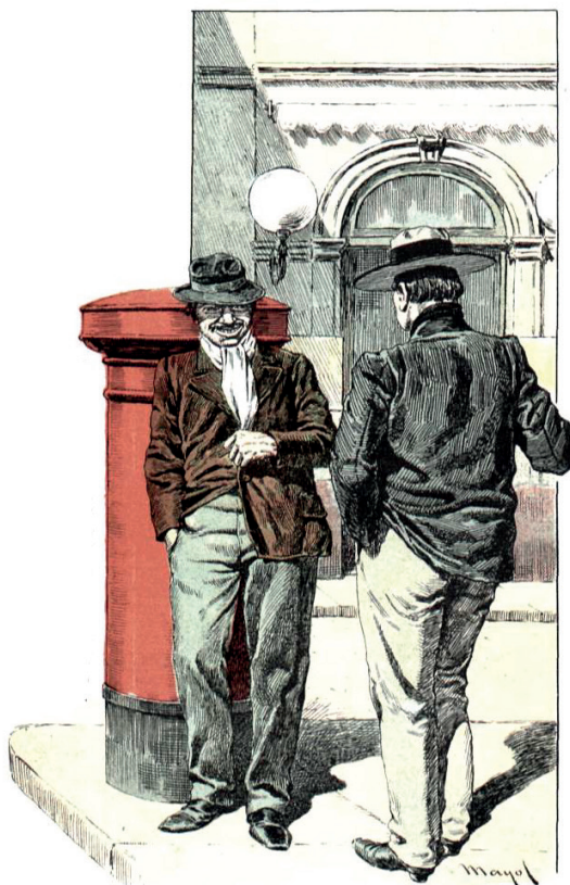
Figura 1. “Entre Amigos”. Ilustración de Mayol.

taba para quedarse. “Tenés pinta de varón”, le diría muchos años después un tango de Di Sarlo y Caprio. Y es que el buzón de la esquina devendría, con el tiempo, en un emblema más de Buenos Aires, parte del escenario de la canción popular citadina. El homenaje al “Pobre buzón” (1954) exaltaba su austera (varonil) capacidad para absorber sin chistar las más intensas historias personales: “Pobre buzón / siempre parado en la esquina / recibiendo por tu herida / pedazos de corazón”. A nadie sorprendía un elogio semejante porque para entonces ya hacía mucho que ese objeto había sido absorbido por el costumbrismo, ubicado en el corazón del folclor de la calle porteña y asociado a sus personajes más emblemáticos.