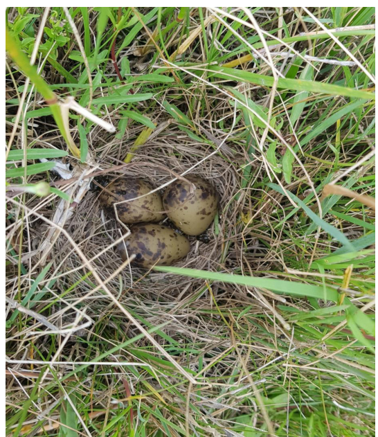
Figura 2. Nido de Becasina de Bañado con puesta de tres huevos.

Barlow 1967), y solo hay un registro en verano (de La Peña 2013). Sobre la extensión de la temporada reproductiva que estamos presentando (octubre a enero), es importante resaltar que nosotros no buscamos ni monitoreamos nidos durante el otoño-invierno,