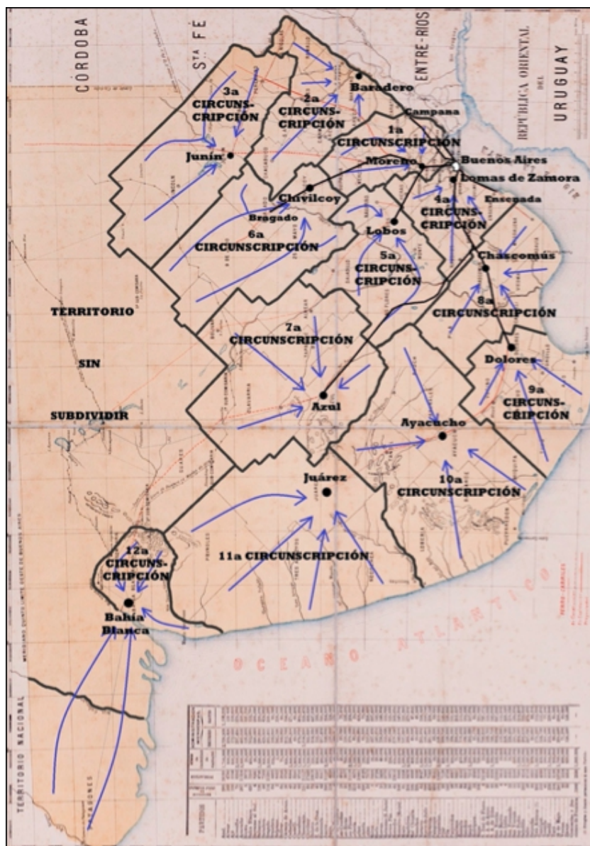
Mapa II. Organización de la Guardia Nacional activa de Campaña en 1879