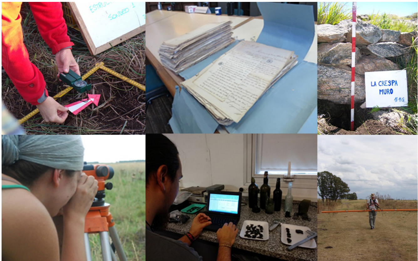
Figura 3. Trabajo de campo y gabinete

Más recientemente, se utilizaron métodos y técnicas procedentes de la geoarqueología para el estudio de zanjas defensivas localizadas en la ciudad de Bahía Blanca y sus alrededores. De este modo, se analizaron distintas estructuras construidas en el siglo XIX a través del análisis de perfiles sedimentológicos (caracterizando granulometría, color, estructuras sedimentarias, presencia de restos orgánicos, entre otros elementos) y mediciones altimétricas con nivel óptico para confeccionar perfiles topográficos de cada una de ellas. Este tipo de metodología, aplicada al estudio de esas construcciones defensivas, no registra muchos antecedentes en la disciplina. A partir de su aplicación fue posible determinar con detalles sus características morfométricas, las modificaciones y los distintos usos dados a través del tiempo, p.e. el regadío de quintas y chacras (Tomassini, 2020).