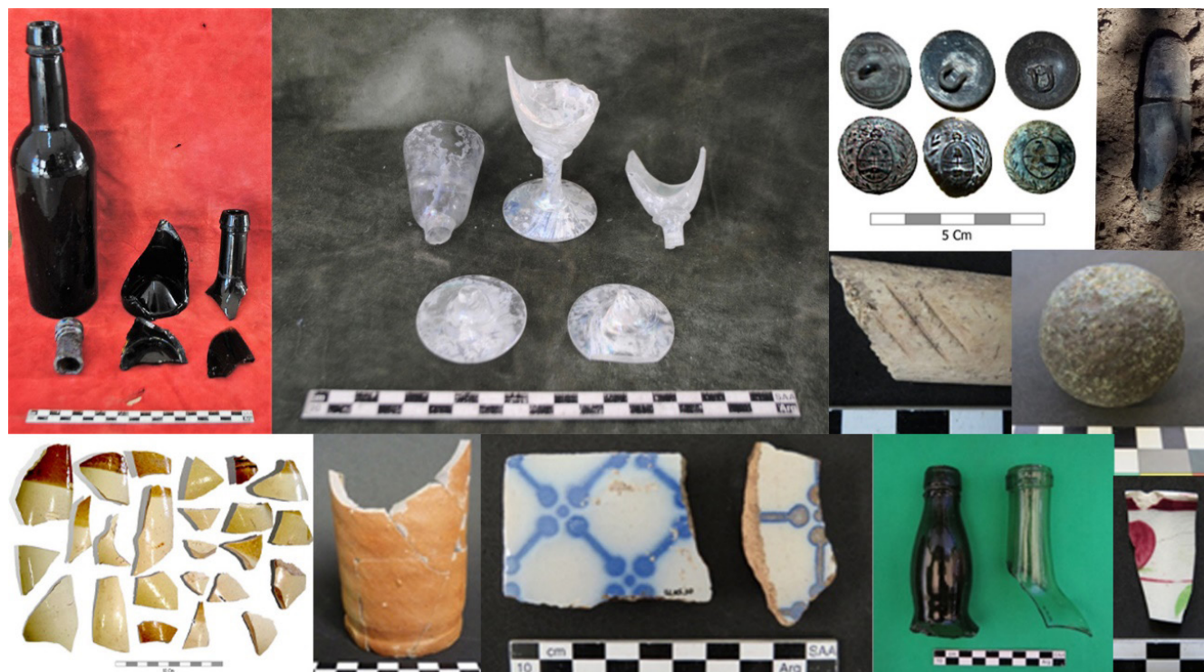
Figura 4. Materiales arqueológicos analizados.

Irene C. Bracco está trabajando con los conjuntos vítreos procedentes de los sitios Tapera de Sabino, Fortín Machado y Las Toscas 3. Siguiendo la metodología propuesta por Pedrotta y Bagaloni (2006), este análisis tiene la finalidad de evaluar la diversidad de artefactos vítreos presentes para poder dar cuenta de los hábitos de consumo y redes de comercio en un contexto de conformación y expansión de fronteras. Puntualmente, se construyó una base de datos para la unificación de criterios de análisis, se estudió el conjunto vítreo del sitio Tapera de Sabino (Bagaloni y Bracco, 2019), están en análisis aquellos hallados de Fortín Machado y se amplió la muestra inicial recuperada en Las Toscas 3. En líneas generales, en todos estos conjuntos hay presentes fragmentos de limetas para ginebra, botellas de espumantes, frascos y tarros, entre otros recipientes.