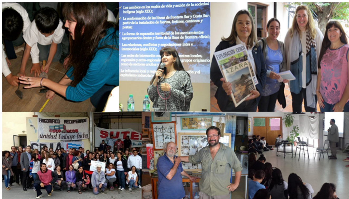
Figura 5. Experiencias con comunidades.

De manera paralela, se desarrollaron actividades en conjunto con distintas comunidades barriales del partido de Bahía Blanca. Con trabajadores y trabajadoras del frigorífico INCOB, una empresa recuperada que es un referente del cooperativismo local, se trabajó en los procesos de producción de conocimiento sobre el pasado y en la toma de decisiones sobre un conjunto de bienes culturales situados dentro de sus instalaciones (Pupio y Tomassini, 2020). En conjunto con el Instituto Cultural de la ciudad, se realizaron actividades educativas infantiles para el día del niño, recorridos históricos por los barrios y charlas para los vecinos y trabajadores. Asimismo, se ha colaborado con otros grupos de investigación dentro de la UNS en el desarrollo de un proyecto educativo para la creación de una escuela primaria donde el personal del frigorífico pudiera instruirse. Por otra parte, se apoyaron los reclamos de restitución de restos humanos que fueron hechos al Museo de la Plata por descendientes de las comunidades indígenas de de Azul y Olavarría (Pedrotta y Bagaloni, 2020).