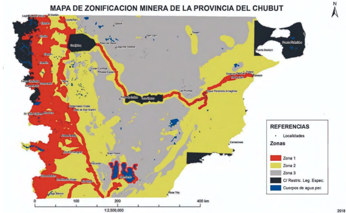
Figura 4. Propuesta de zonificación minera del Gobierno de Chubut: la zona 3 (en gris) es determinada como la más favorable para la explotación minera