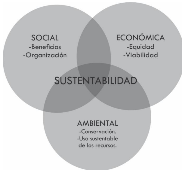
Figura 2. Pilares para la sustentabilidad.

potenciar el aprovechamiento integral de los recursos renovables y la minimización de los recursos no renovables, la polución, daños ambientales y daños a la salud. El pilar económico, refiere a la equidad entre naciones y generaciones, buscar evitar los intercambios desparejos y en la distribución del costo-beneficio, y apunta también a la viabilidad de propuestas, la cual asegura costos reales y apunta al apoyo de las economías locales y promueve políticas éticas. El último pilar, la sustentabilidad social, refiere a aquellas cuestiones que permitan mejorar la calidad de vida, la equidad social y la integración cultural, y al mismo tiempo defender la independencia y autodeterminación, la participación y la cooperación (Evans, 2010). Considerando estas dimensiones, se confeccionaron los ejes del instrumento de evaluación propuesto y se definieron sus indicadores a aplicar en los casos de estudio.