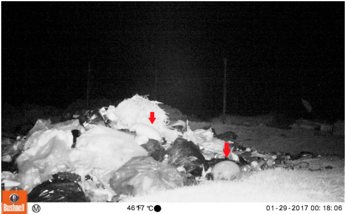
Figura 1. Imagen tomada por una cámara trampa instalada en el basural de la Estancia Cullen, Isla Grande de Tierra del Fuego (-52,859232° -68,409966°), donde se observan dos ejemplares de Chaetophractus villosus .