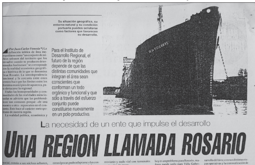
Figura 2. La idea de integración en los titulares de la prensa