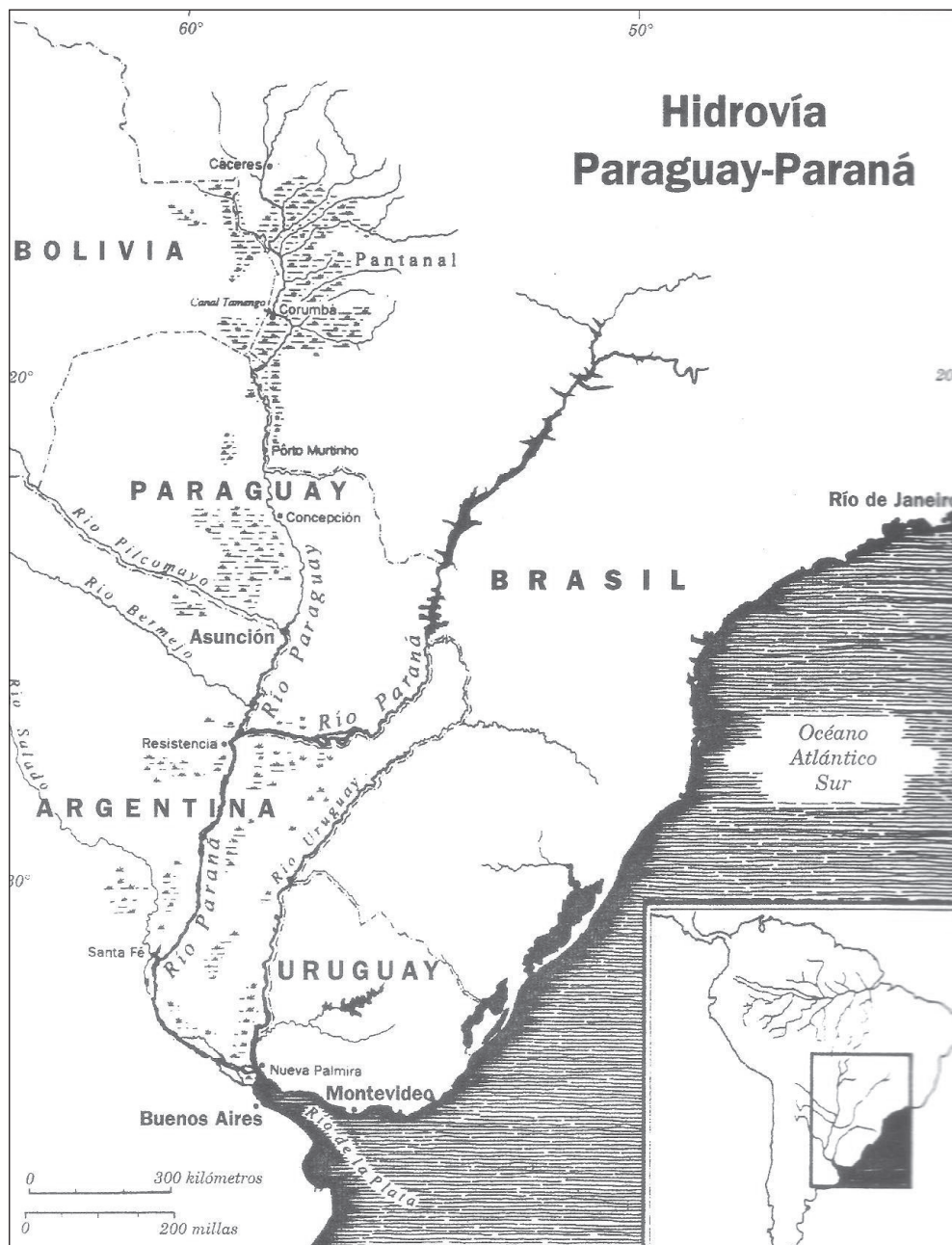
Figura 1. Proyecto original Hidrovía Paraguay-Paraná

Privatización, eficiencia e integración: la "verdad" sobre la Hidrovía Paraguay-Paraná en la Argentina de los 90