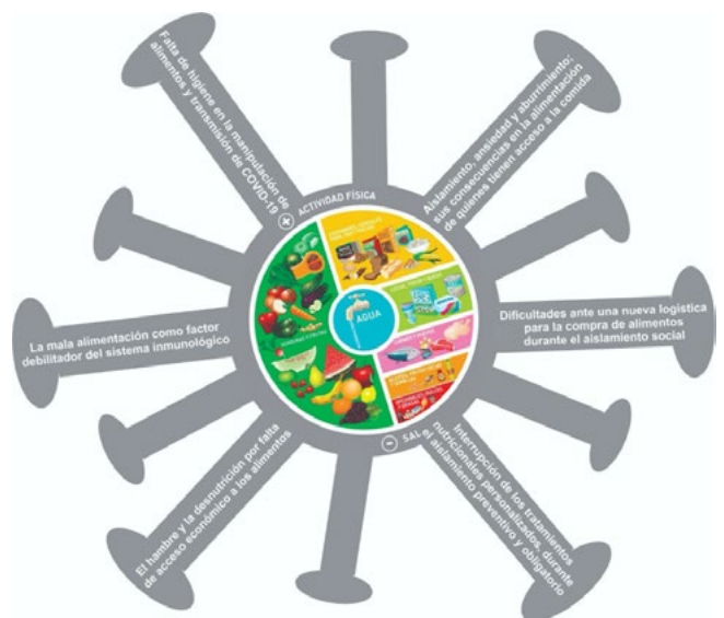
Figura 1. Aspectos de la situación problemática: aislamiento y alimentación

Todos los registros fueron analizados con el Método Comparativo Constante (16) y la teoría fundamentada. Se compararon contenidos de incidentes o unidades de sentido de las entrevistas que permitieron identificar los temas emergentes y, por comparación, se encontraron categorías recurrentes para la comprensión del fenómeno en estudio (17).